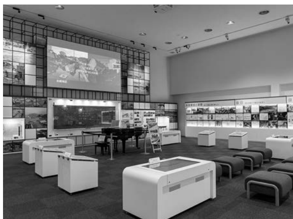
いわき震災伝承みらい館

面積は約100平方キロメートル、日本国内で4番目に広い湖。湖水の透明度が高く、「天鏡湖」とも呼ばれる。湖のほとりから雄大な磐梯山が望める。カヌー体験は手軽に楽しむことのできる裏磐梯の定番アウトドアスポーツ