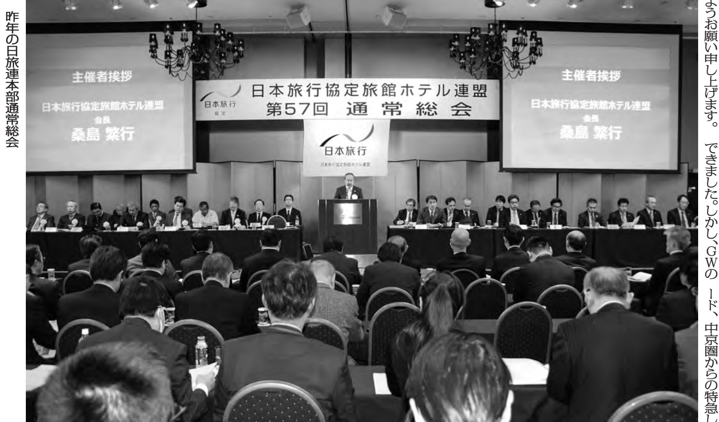
日本の日旅連本部通常総会