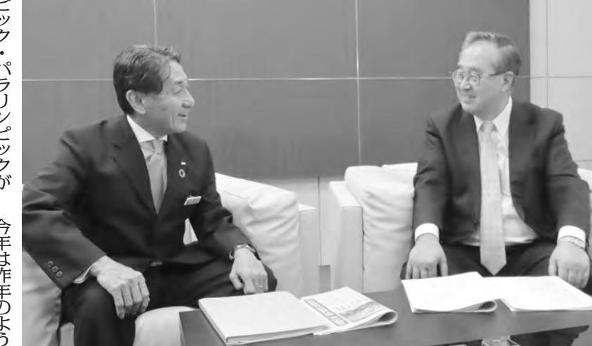
対談は東京の日本旅行本社で実施

「観戦で来日されたお客さまも、まだという人が来ていた。これが効果的なのだと実感した。われわれ宿泊業界として、外国人の新たな在留資格、特定技能、制度ができたことも大きな出来事だ。旅館ホテルは人手不足で、これからは人口が減り、働き手が減っていく。今後も労働力人口と生産年齢人口は減少し、近未来に深刻な打撃を与えるといわれている。将来に向けて良い制度ができたと思っている。マイナズ面は、やはり自 「観戦で来日されたお客さまも、まだという人が来ていた。これが効果的なのだと実感した。われわれ宿泊業界として、外国人の新たな在留資格、特定技能、制度ができたことも大きな出来事だ。旅館ホテルは人手不足で、これからは人口が減り、働き手が減っていく。今後も労働力人口と生産年齢人口は減少し、近未来に深刻な打撃を与えるといわれている。将来に向けて良い制度ができたと思っている。マイナズ面は、やはり自