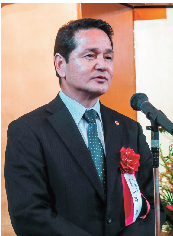
温泉100選3位 指宿温泉