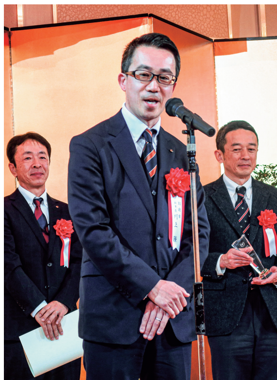
温泉100選2位 別府八湯