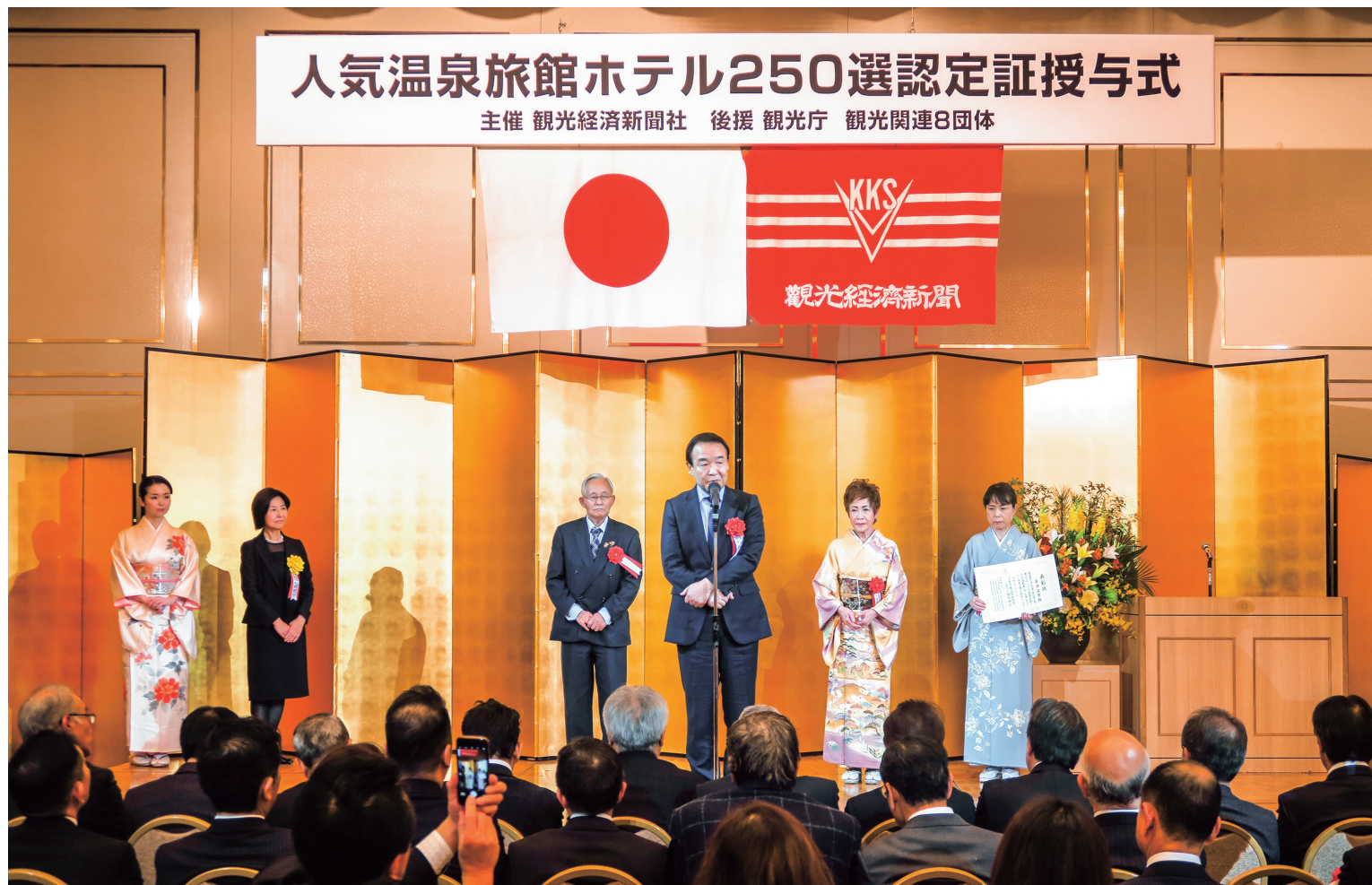
温泉100選1位 草津温泉