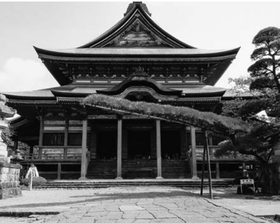
秘仏を特別公開する甲斐善光寺