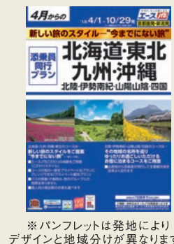
※パンフレットは発地によりデザインと地域分けが異なります。