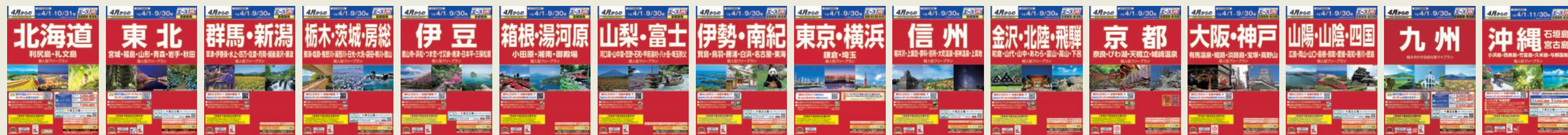
※パンフレットは発地によりデザインと地域分けが異なります。

エースJTBの赤いパンフレットでは品質へのこだわりに加え、お客様に「泊まる」楽しさをお届けするため、それぞれのホテル・旅館の楽しみ方を「エースJTB」のお約束としてご提案しています。