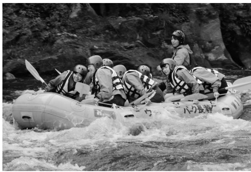
自然を感じ、チームワークを育むラフティング