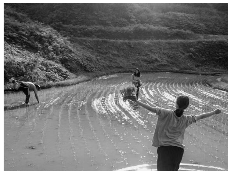
米どころ新潟での田植え体験