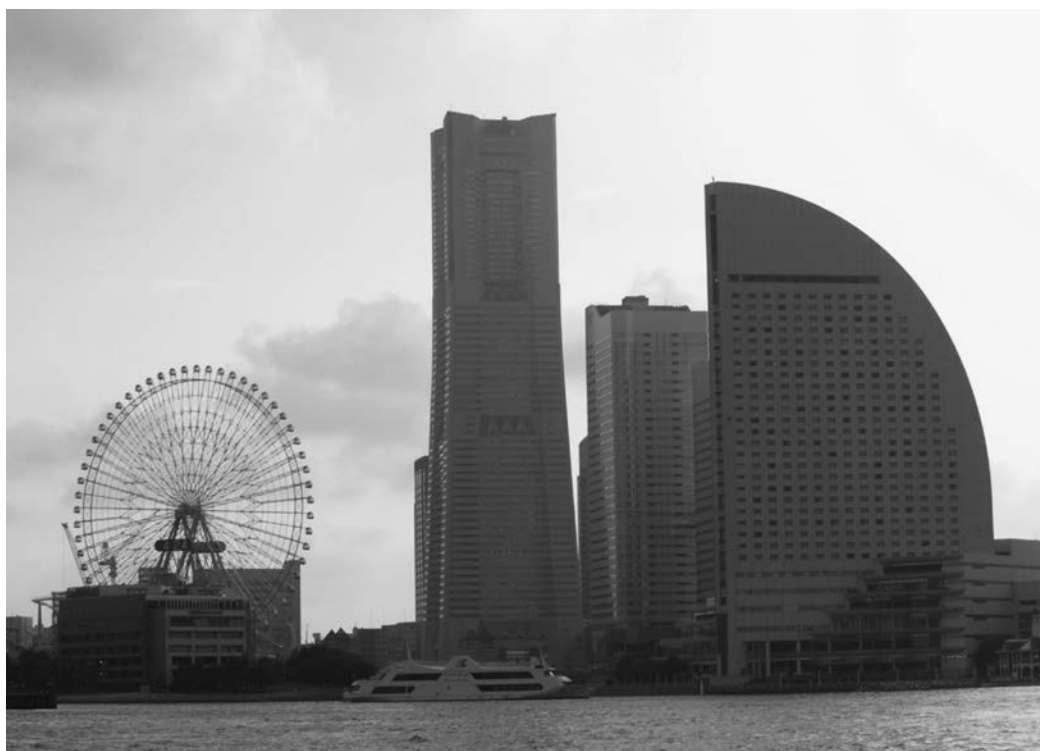
観光客が増加した横浜・川崎地域（横浜みなとみらい地区）