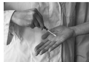
専用綿棒で拭き取る

旅館・ホテルにとって役立つ品々を紹介するシリーズ。今回は「客室備品・必需品」をテーマとして、4つの商品にスポットを当てた。