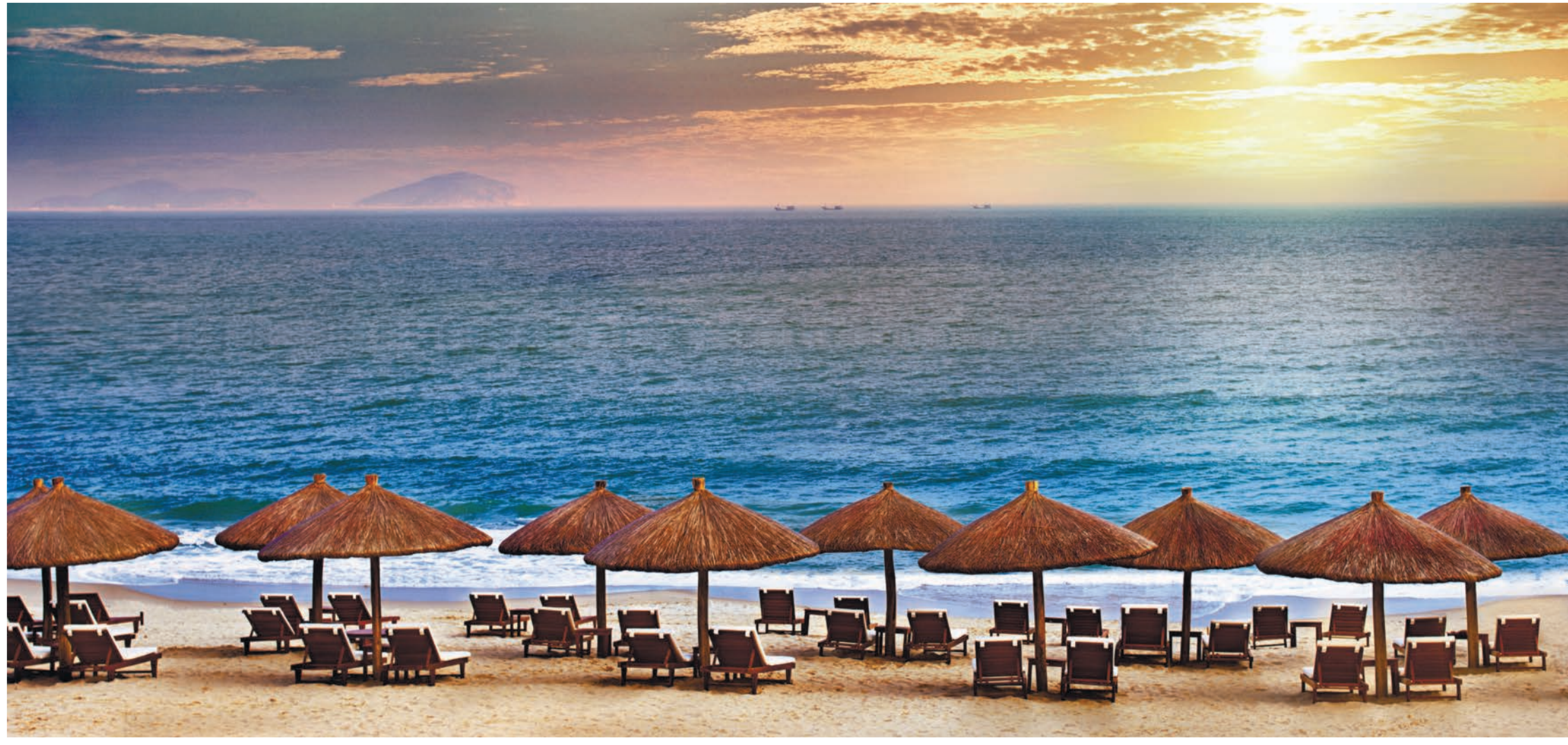
三亜・亜龍湾ビーチ

古文明 中華文明発祥の地 故宮など17の世界遺産 中国駐東京観光代表処と河北、河南、山東、山西の4省を中心とする「古文明」をテーマとした旅を提案している。北京、天津の2市「古文明」をテーマとして、中原とは異なる歴史を学ぶことが出来る。北京、天津の2市「古文明」をテーマとして、中原とは異なる歴史を学ぶことが出来る。