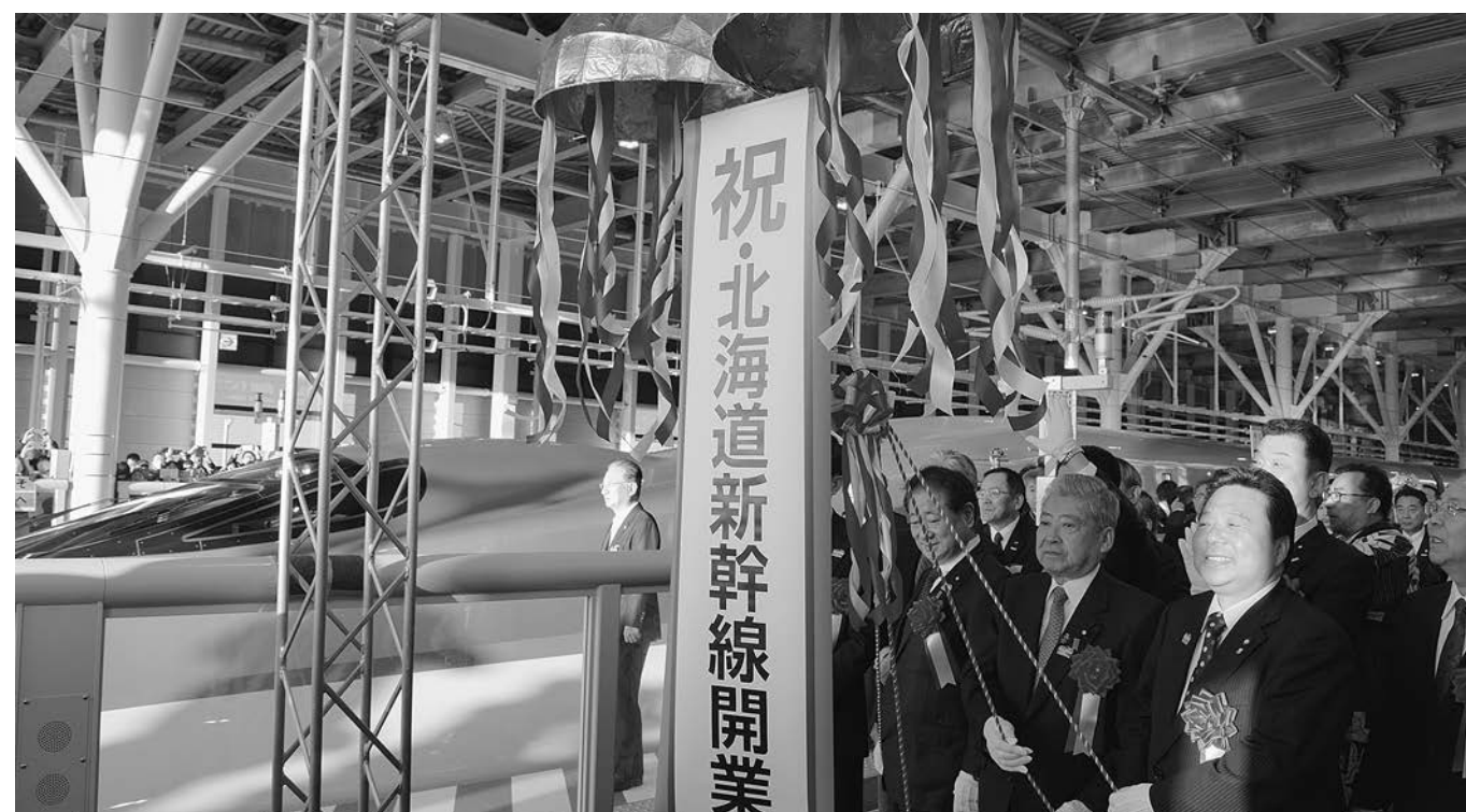
昨年3月26日に開業した北海道新幹線