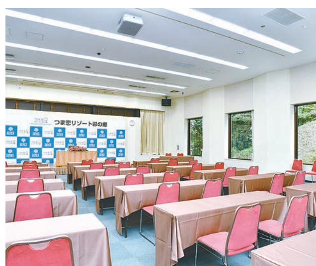
カンファレンスセンター

目的や人数に合わせて選べるさまざまなタイプの会議・研修施設がある。100万本の木々に代表される大自然に囲まれた閑静な立地や、全てのカリキュラムを同じ敷地内で管理できること、宿泊やレクリエーション施設が併設されていることなど、同地ならではのメリットがある。 コンベンションホールは、大規模な式典・会議に対応可能。L室、M室、S室の三つの部屋を備え、L室とM室を1室として利用すると、収容人数1500人の大ホールとなる。主な用途は周年記念式典、大規模会議、講演会、シンポジウム、学会、レセプションパーティーなど。音響、照明設備ほか、ギガビット対応LANコンセントを備