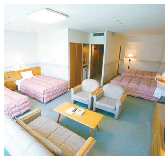
ホテルノースウイング客室

最大3人。標準的な客室面積は28.0平方メートル。全室がバス、シャワールーム、奥に冷蔵庫を装備。行きも戻る広々とした緑をながめるテラス付き。 大浴場はホテルノースウイング隣の「ガーデンヒーリング」に併設。エレベーター、天然温泉施設「レストラン」に併設。エレベーター、天然温泉施設「レストラン」に併設。エレベーター、天然温泉施設「レストラン」に併設。