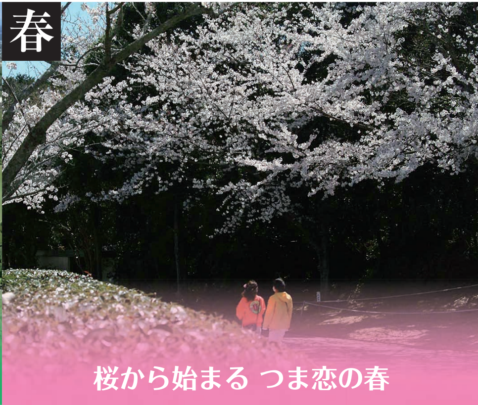
桜から始まる つま恋の春