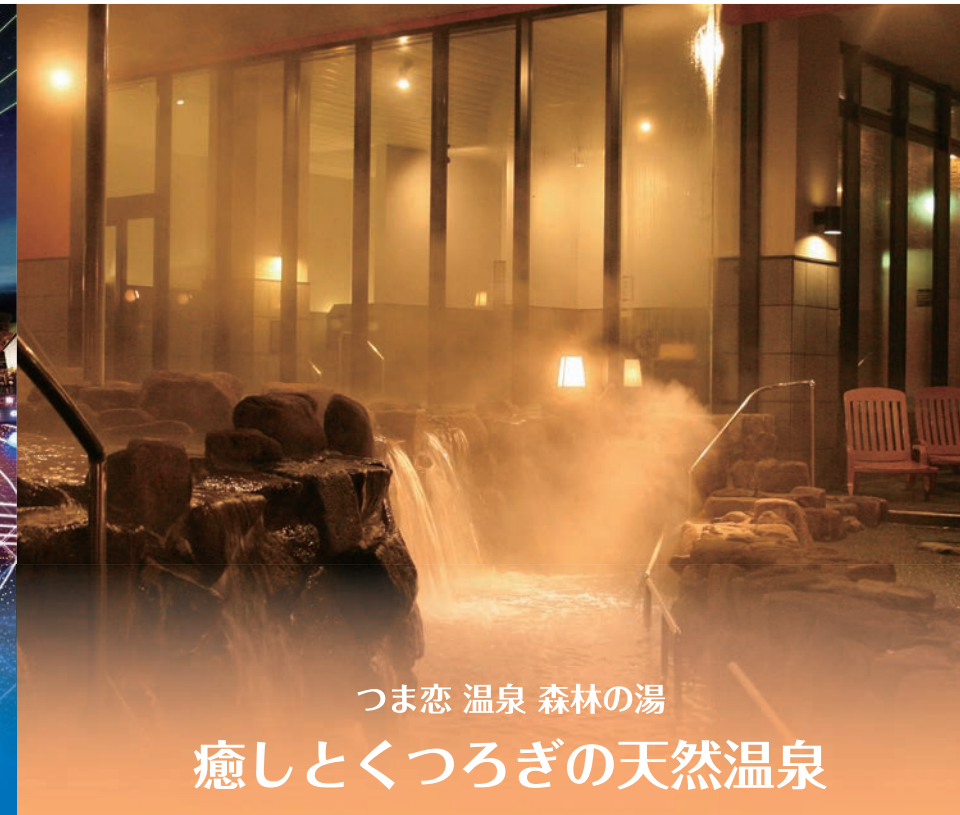
つま恋 温泉 森林の湯