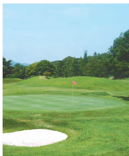
ゴルフショートコース

100万本の木と5600本の桜が彩る大自然の中に、さまざまなスポーツを楽しむ施設がある。国際大会も開かれるなど、設備が充実している。 グリーンは天然芝2面、人工芝2面を使用し、第一多目的広場ではラグロス、サッカー、ラケットなどが楽しめる。2009年のラグビーワールドカップや2020年のオリンピック選手も利用可能な設備が整っている。 ゴルフは56軒から146軒までのオールパース、9ホールの天然芝の本格的なコースレイアウトで、初心者からベテランまで楽しめる。 29打席、2000坪のゴルフ練習場も整備。防球ネット