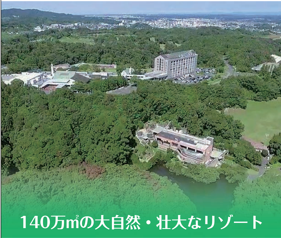
140万㎡の大自然・壮大なリゾート

東京から新幹線で110分、車で120分の好アクセス。駐車場3000台有。 ☎0120-244-255 http://www.tsumagoi.net 〒436-0011 静岡県掛川市満水 2000 番地 TEL0537-24-1111 FAX0537-62-0344