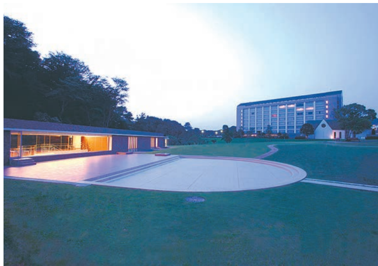
ミュージックガーデン

の再現が可能。 音楽の練習や会議・研修が行える各種スタジオも完備。スタジオM1〜M5は、収録人数20人程度の会議・研修室。スタジオM6〜M8は、スタジオM1〜M5よりひとまわり大きいサイズの会議・研修室。 スタジオは、収録人数30人程度の会議・研修室。スタジオM1〜M5は、収録人数100人程度 のコンベンション施設。100名程度の研修や会議を行うことができる。スタジオM1〜M5は、設備を揃えている。収録人数20人程度の会議・研修室。スタジオM6〜M8は、収録人数30人程度の会議・研修室。スタジオM1〜M5は、収録人数100人程度