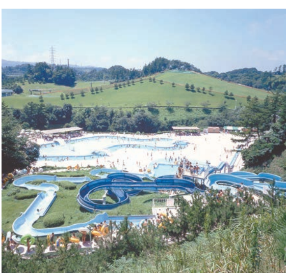
ウォーターパーク

プールは流速が毎秒0.7〜0.77の流水プール。設備がきれいなナイトウォーターをはじめ、水深1メートルの遊泳プール、水深3メートルの遊泳プール、水深3メートルの遊泳プール、水深3メートルの遊泳プール。今年の営業期間は7月15日〜9月18日まで。午前9時から午後9時までの営業を予定。