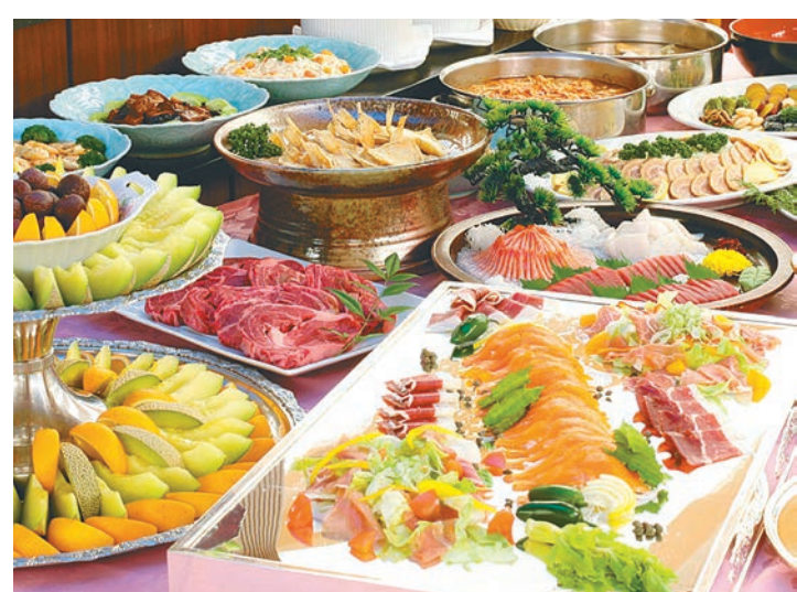
ピュッフェテラス

ことが可能だ。また、100名から300名の団体利用「コンベンションホール」に朝、昼、夜と利用することも可能だ。パーティー、宴会には、