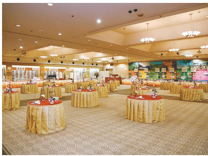
コンベンションホール

えている。 カンファレンスセンターは、最新技術を駆使した防音設備を備え、最大1200人を収容できる。居心地の良さと利便性を兼ね備えた。主として、大規模な式典・分科会、集会、研修など、イベントなど多彩に利用可能。ギガビット対応LANコンセントや、コピー機能、オーディオ・ビデオ接続機能、無線LAN機能などを備えている。 ミーティングルーム・ピクニックセンターは、ホテルのホールをはじめ、音楽スタジオや会議室、研修施設を併設している。インテグレーション（ミテ）備えている。