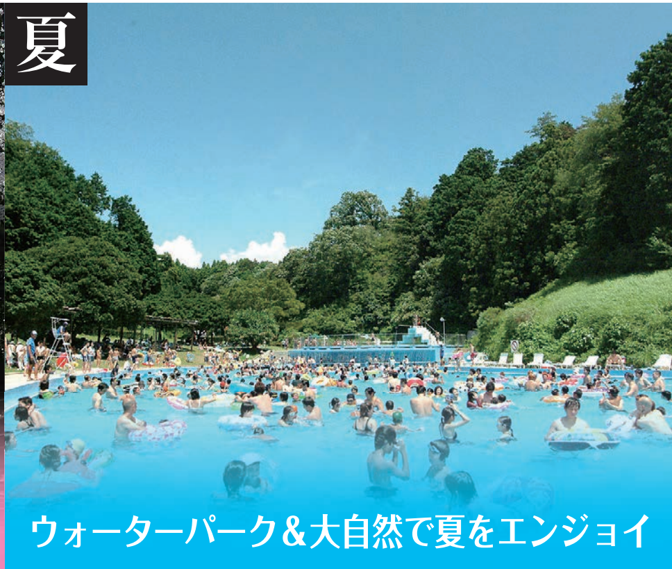
ウォーターパーク&大自然で夏をエンジョイ