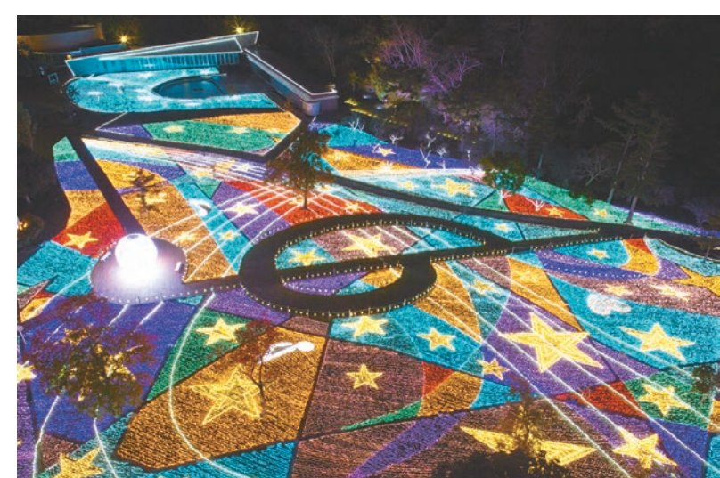
つま恋サウンドイルミネーション