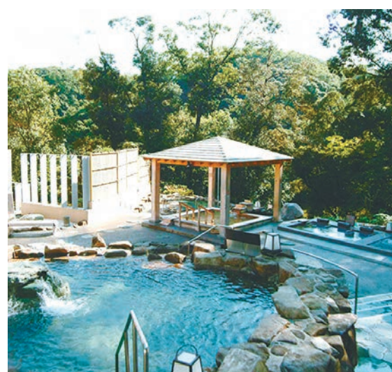
つま恋温泉 森林の湯

泉質はナトリウム・塩化。さまざまな疾病に効果。物温泉、神経痛、筋肉痛などがあるといわれる。