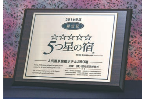
「人気温泉旅館ホテル250選」に5年連続で入選した「5つ星の宿」の認定盾