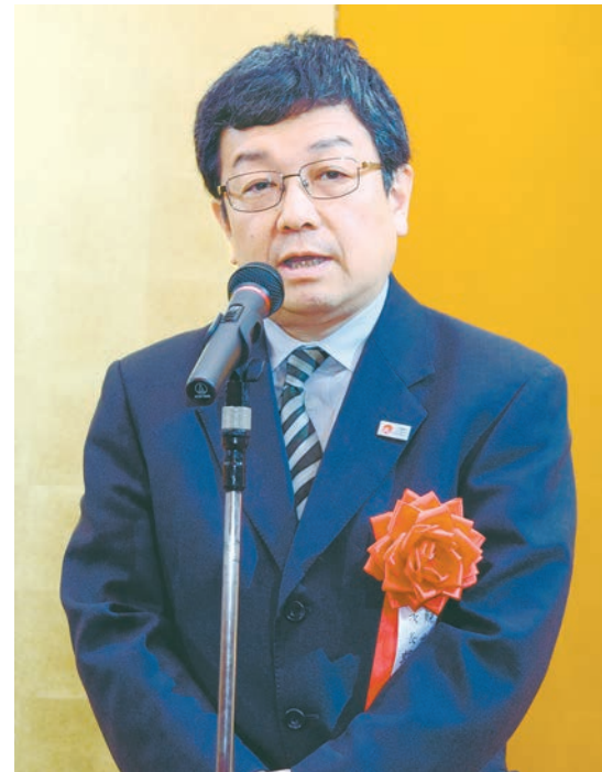
祝辞を述べる観光庁の蝦名邦晴次長