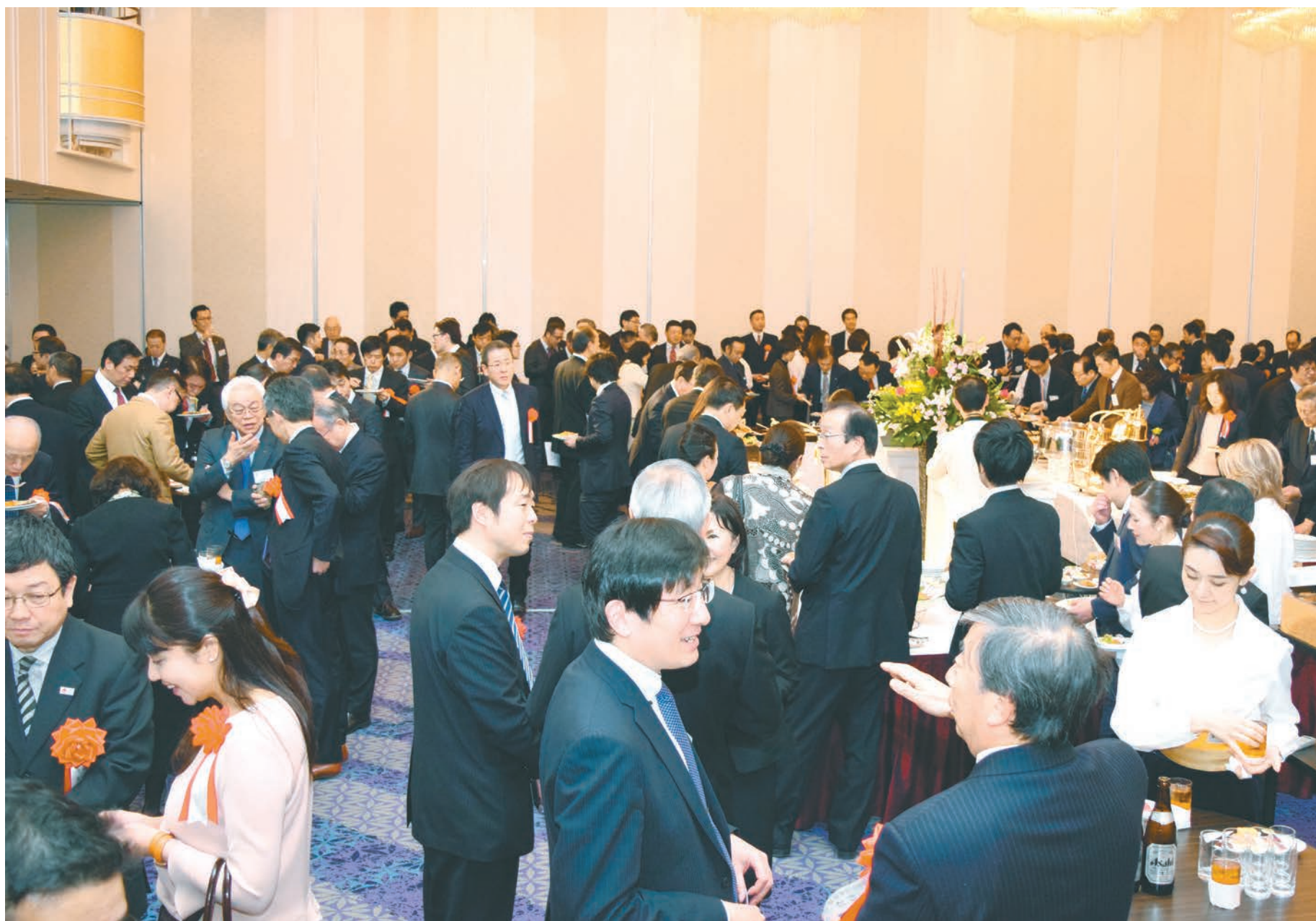
出席者同士が和気あいあいと語り合った懇親パーティー