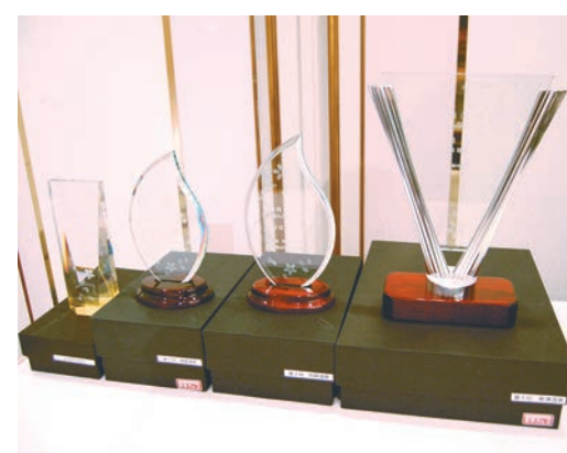
にっぽんの温泉100選のトップ3、実行委員会特別賞の温泉地に贈られたトロフィー。右から1位・草津温泉、2位・別府温泉、3位・指宿温泉、実行委員会特別賞・阿寒観光協会まちづくり推進機構