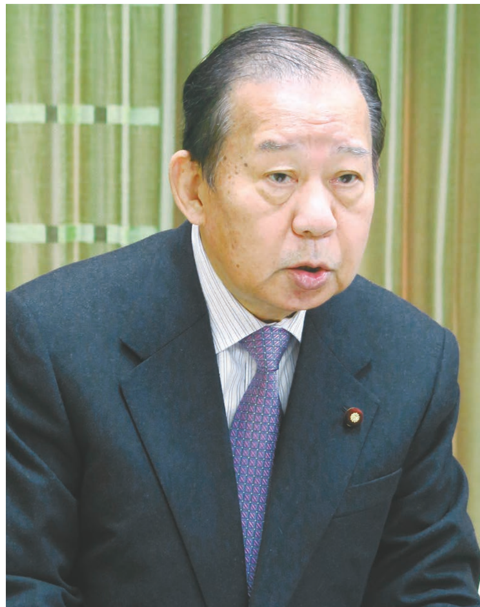
通常国会開会のため出席できなかった自由民主党の二階俊博幹事長(衆議院議員、全国旅行業協会会長)は、ビデオメッセージで会と入選施設に祝辞を贈った