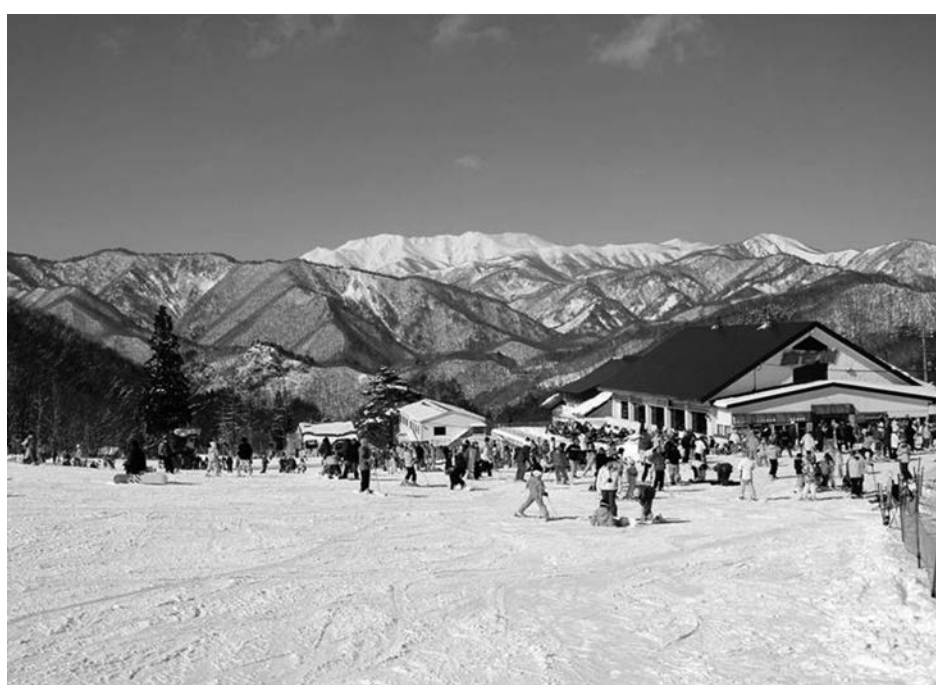
みなかみ町のスキー場