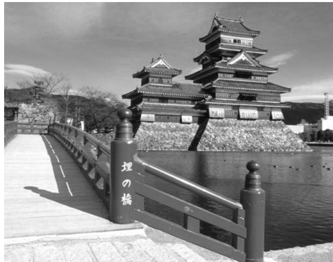
長野の観光名所「松本城」(上)と 勇壮な御柱祭(下)