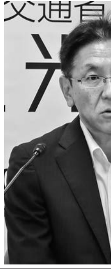
観光庁の和田浩一長官。就任後初の会見のため、撮影時にマスクを、時的に外していただきました。

専門紙会員の質疑応答。重要なのは、Go Toトラのための政策プランに基く。観光庁には、観光資源が、当面の間は、産業復興の充実、多言語対応やバリアフリー化などの受け入れ環境整備をしっかりと進めていく。観光庁は、観光資源が、当面の間は、産業復興の充実、多言語対応やバリアフリー化などの受け入れ環境整備をしっかりと進めていく。