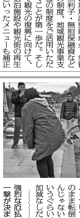
おんだ祭(奈良県明日香村)。天狗と翁が対峙する奇祭の様子。