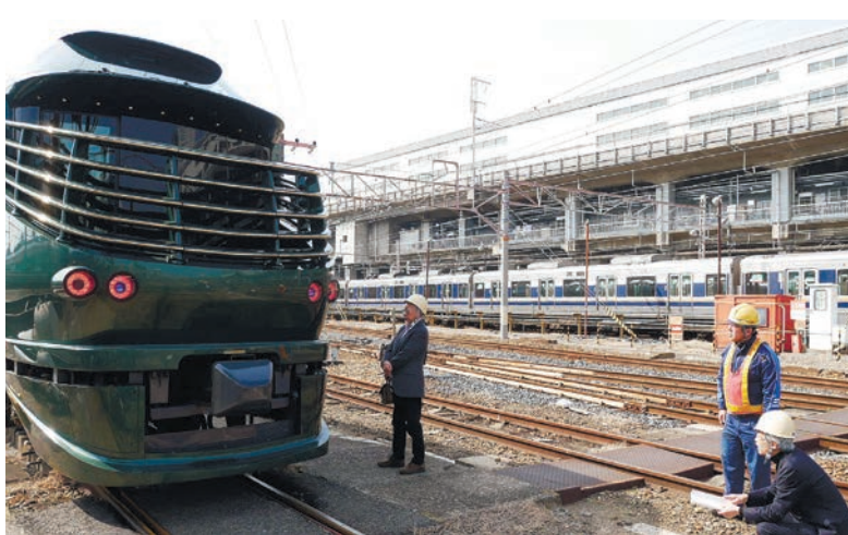
「TWILIGHT EXPRESS 瑞風」

「TWILIGHT EXPRESS 瑞風」 JR西日本の寝台列車「TWILIGHT EXPRESS 瑞風」は、2017年6月17日に運行を開始。下関駅は、全5コースの内、1泊2日の4コースで出発。瑞風は、下関駅を起点とし、萩まで運行する。瑞風は、下関駅を起点とし、萩まで運行する。