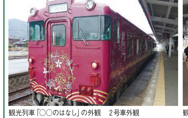
観光列車「〇〇のはなし」の外観 2号車外観

「TWILIGHT EXPRESS 瑞風」 JR西日本の寝台列車「TWILIGHT EXPRESS 瑞風」は、2017年6月17日に運行を開始。下関駅は、全5コースの内、1泊2日の4コースで出発。瑞風は、下関駅を起点とし、萩まで運行する。瑞風は、下関駅を起点とし、萩まで運行する。