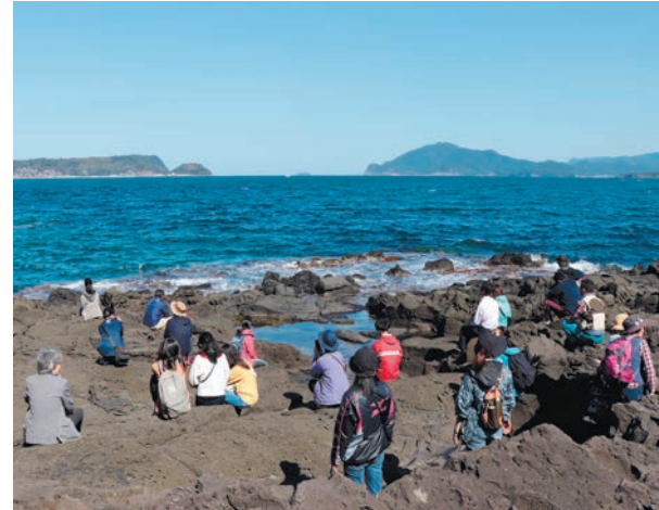
萩ジオパークガイドツアー