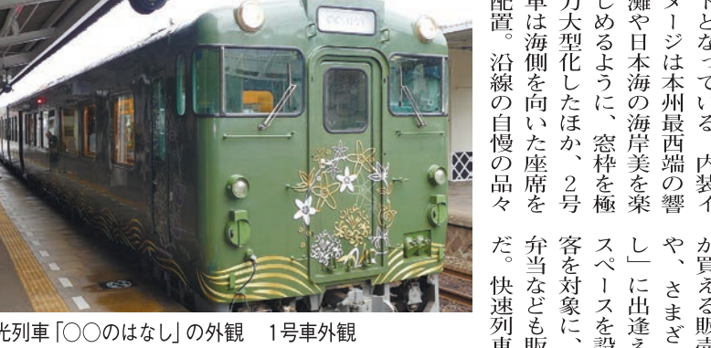
観光列車「〇〇のはなし」の外観 1号車外観