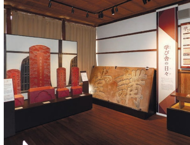
明倫館関連の展示