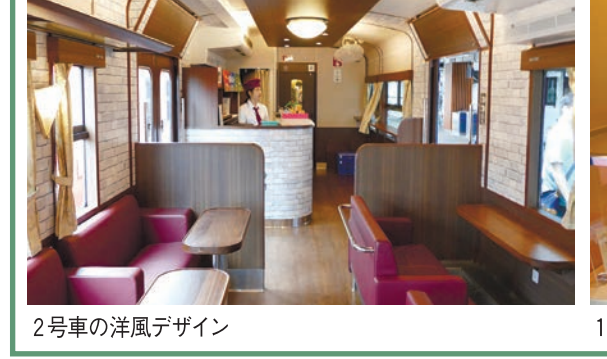
2号車の洋風デザイン