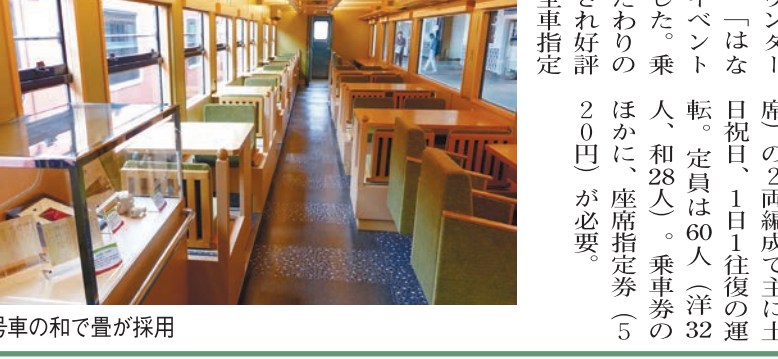
1号車の和で量が採用