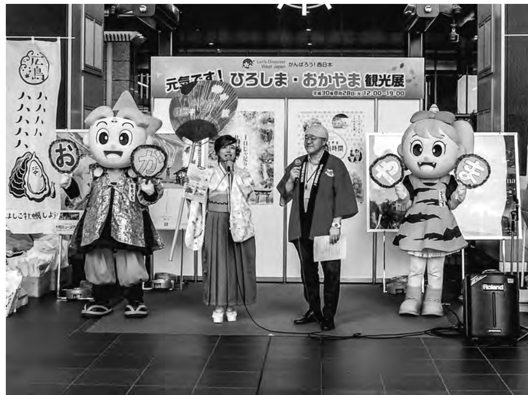
広島、岡山両県がJR大阪駅で「元気です!ひろしま・おかやま観光展」を開催。西日本豪雨の風評被害払拭に向けたキャンペーンの一環(9月8日付)

「ツーリズムEXPOジャパン2018」が東京ビッグサイトで開かれ、過去最高の20万7千人の来場者を集めた(9月29日付、10月6日付)