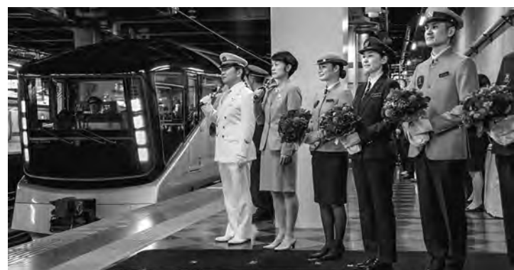
JR東日本のトランスイット四季島の運行開始1周年記念セレモニーが東京のJR上野駅で開かれた(5月12日付)