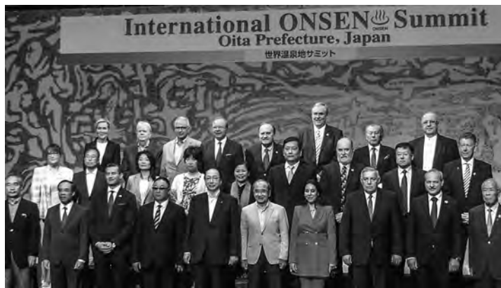
世界初となる「世界温泉地サミット」が大分県別府市で開催(5月31日付)