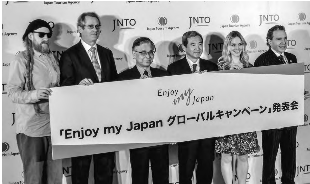
観光庁とJNTOが欧米豪を主な対象に新たな訪日プロモーション「Enjoy my Japan グローバルキャンペーン」を開始(2月17日付)