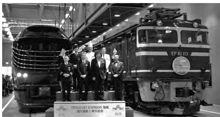
JR西日本のトワイライトエクスプレス瑞風が運行1周年。記念事業として京都鉄道博物館では新旧のトワイライトエクスプレスがそろって展示された(6月30日付)