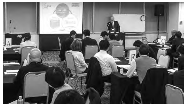
政府が生産性向上を推進。観光庁は宿泊業向けに生産性向上セミナーを開いた(3月10日付)