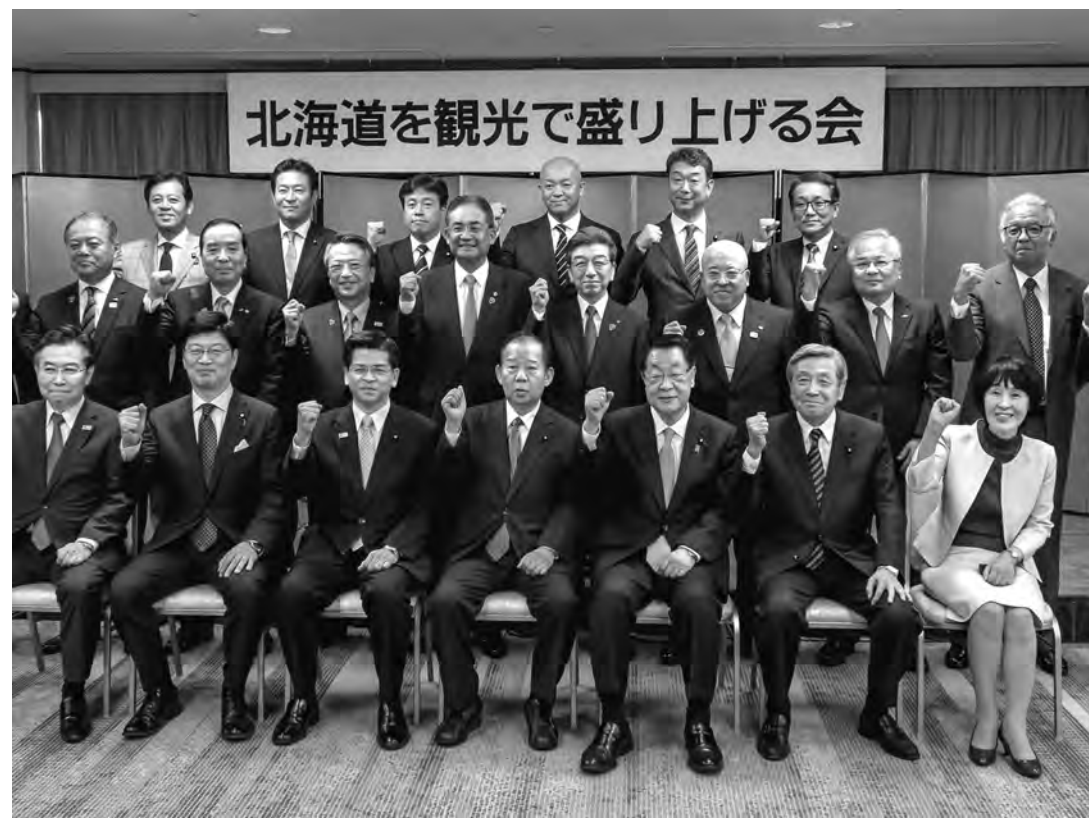
9月の胆振東部地震で大きな打撃を受けた北海道内観光の復興に向けた機運醸成を図る「北海道を観光で盛り上げる会」が東京で開かれた(11月3日付)