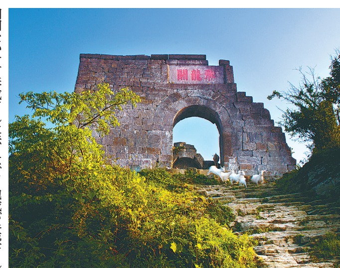
土司の遺跡群 (播州海竜屯遺跡)