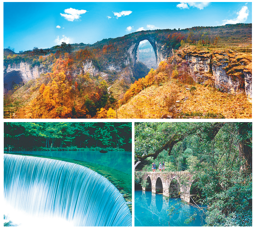
中国南方カルスト (上=大七孔風景区、右下=小七孔風景区、左下=小七孔の湖・臥龍潭)

の日本では山口県の秋吉台が有名。貴州省は総面積の73%がカルストといふ。世界遺産を構成するのは、雲南省の「石林」、重慶市の「武隆」、そして貴州省の「荔波」(れいは)の各カルスト。2014年、中国南方カルスト(れいは)はこれに加え、広西チワン族自治区の「桂林」などに加わった。