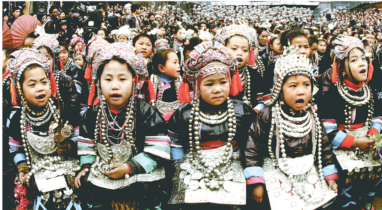
世界無形文化遺産に登録された「トン族大歌祭り」