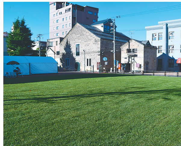
中庭は観光客と市民の憩いの場に

光客が一息つけるような小樽芸術村は、敷地面積約1万平方メートル。そのうち約5千平方メートルは、建物部分を除く約1万7000平方メートルの中庭として、観光客や市民らに開放している。 9月1日、グランドオープン記念式典をこの中庭で、多岐の観光客、市民らに開催。今後、さまざまなイベントを予定して、域だが、木々の緑と、観る。