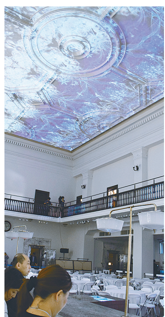
天井にはプロジェクションマッピングを投影

「似鳥美術館」とともに建築界を代表する會社に今回オープンしたのが、建築事務所が設計した「旧三井銀行小樽支店」だ。重厚な石積みバルコニー、サンルームの外観、回廊、造り、地下1階に広がる吹き抜け、石膏彫刻が美しい天井と、建物小樽市の有形文化財に指定された。