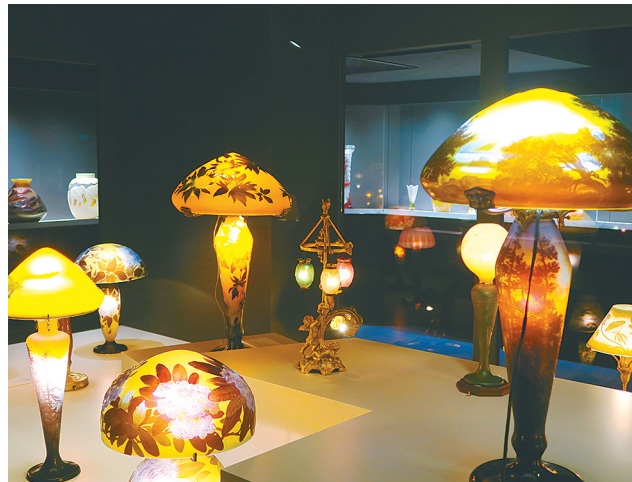
似鳥美術館地下に展示したガラス作品

今回オープンした「似鳥美術館」は、旧北海道拓殖銀行小樽支店の建物を活用。日本と世界の巨匠による絵画や彫刻、ガラス作品など、美術品の数々を展示している。旧北海道拓殖銀行小樽支店は1923(大正12)年の建築。鉄筋コンクリート造り、地上4階地下1階建てで、1991(平成3)年10月4日、小樽市の歴史的建造物に指定された。