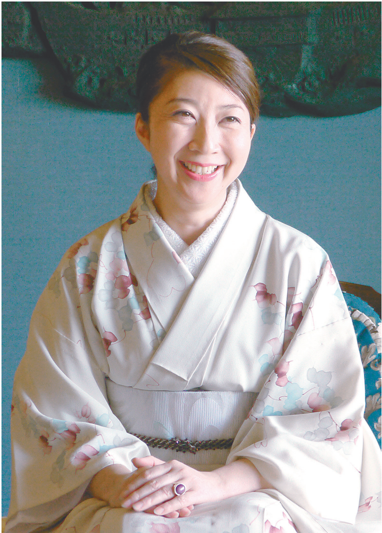
黒船ホテル若女将