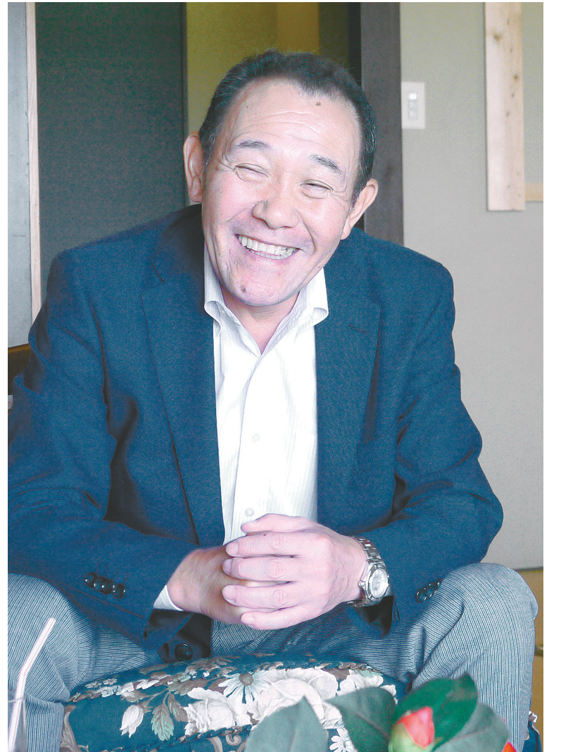
コーセーコスメピア社長