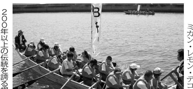
シーカヤック体験