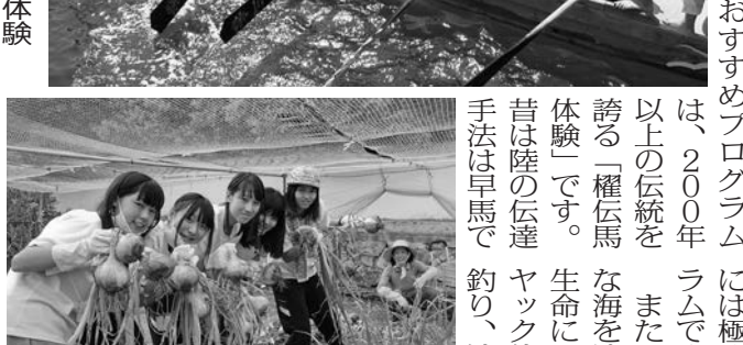
農業や食を学ぶ農業体験