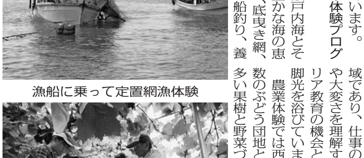
西日本有数のぶどう団地で農業体験