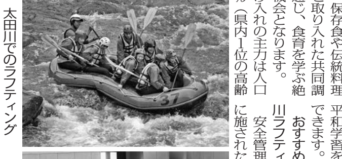
太田川でのラフティング

人情田舎体験の主な活動として、安芸太田町(あきおわた)は、西中国の山間地帯に位置する。自然環境に恵まれた町で、唯一山地を越える道路が山間の町で、その山を越えるには、日本が誇る山岳登山の道である。