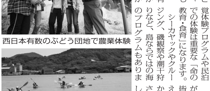
穏やかな瀬戸内海でシーカヤック

広島湾ベイエリア・海生都市圏研究協議会 (広島商工会議所 産業・地域振興部 地域振興チーム内) 担当(大邑・久保田) 営業時間 月～金曜日 8:30～17:30(祝日は除く)