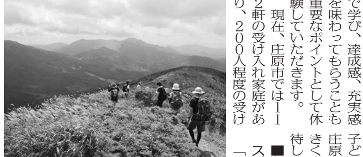
吾妻山トレッキング