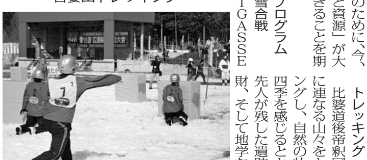
高野で開催される雪合戦大会

中野市北部には、西日本では珍しいリンゴの栽培が盛んで、寒暖差の大きい高冷地ならではの気候を生かした甘み強いリンゴ作りが行われています。一年を通して行われる栽培過程から、農業本来の厳しさや食育、そしてその地域での文化を学びます。