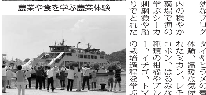
島ならではのフェリーでお別れ

瀬戸内海特有の温暖な気候と風光明媚な環境の中、島という限られた土地に生き、追放された土着の文化を伝える。2000年以上の伝統を誇る権佐馬体験、2000年以上の伝統を誇る権佐馬体験。