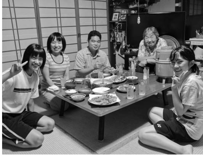
絆や命の大切さを身をもって学ぶ人情田舎民泊体験

人情田舎体験の主な活動として、安芸太田町(あきおわた)は、西中国の山間地帯に位置する。自然環境に恵まれた町で、唯一山地を越える道路が山間の町で、その山を越えるには、日本が誇る山岳登山の道である。