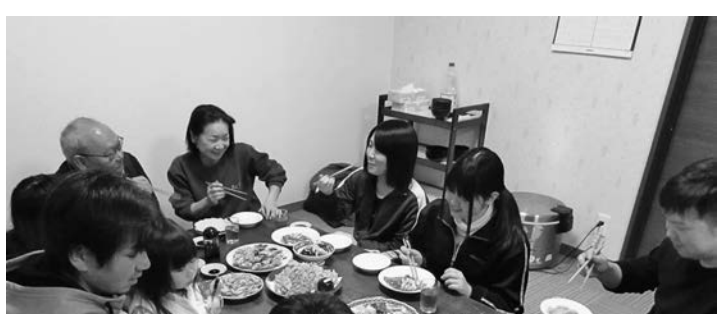
民泊での団らんは人間関係構築能力の向上に極めて有効

広島湾ベイエリア・海生都市圏研究協議会 (広島商工会議所 産業・地域振興部 地域振興チーム内) 担当(大邑・久保田) 営業時間 月～金曜日 8:30～17:30(祝日は除く)