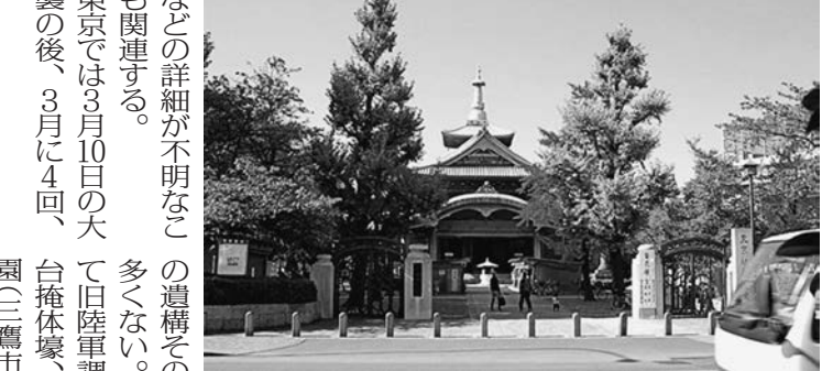
戦後の原爆ドーム