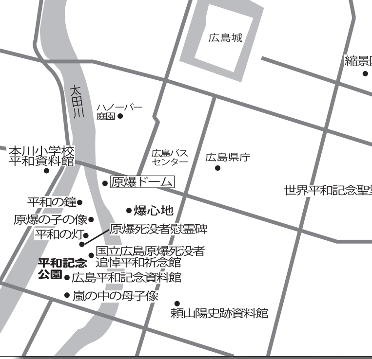
平和記念公園の原爆死没者慰霊碑

ドームの名「世界遺産」と呼ばれる。原爆ドーム周辺の平和記念公園には、平和学習の場として、平和記念資料館や平和の鐘、平和の灯、平和の像などが設置されている。