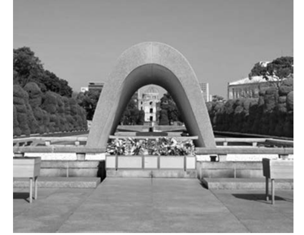
平和記念公園の原爆死没者慰霊碑