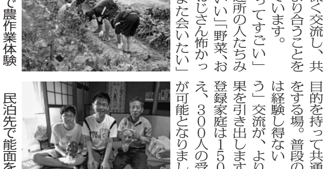
スライ先農作業体験