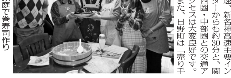
民泊家庭で巻寿司作り