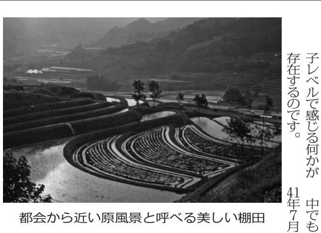
都会から近い原風景と呼べる美しい棚田

奈良県高市郡明日香村島庄5番地 (明日香村商工会館内) TEL 0744-54-1525 FAX 0744-54-1526 E-mail:info@asukacom.jp URL http://www.asukacom.jp