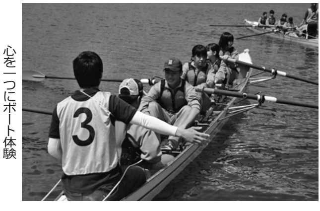
心をつなぐ民泊体験