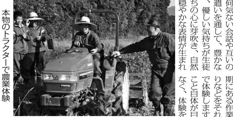
本物のトラクターで農業体験