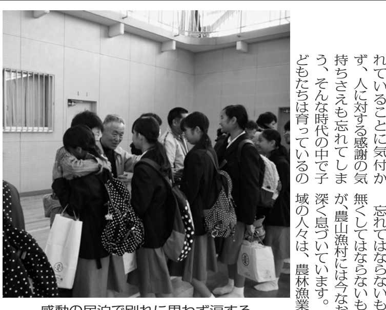
感動の民泊で別れに思わず涙する