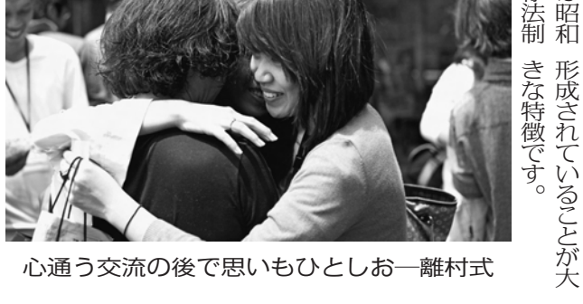
心通う交流の後で思いもひとしお一離村式