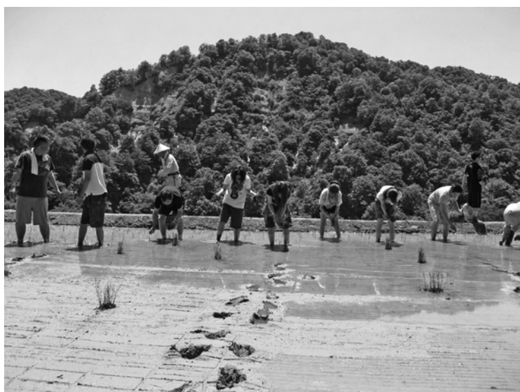
素足で田んぼに入り米どころ新潟で田植え体験