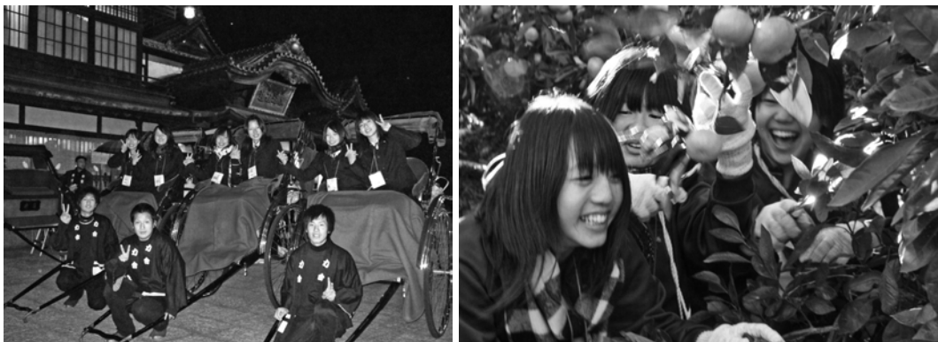
道後温泉本館前で人力車の乗車体験