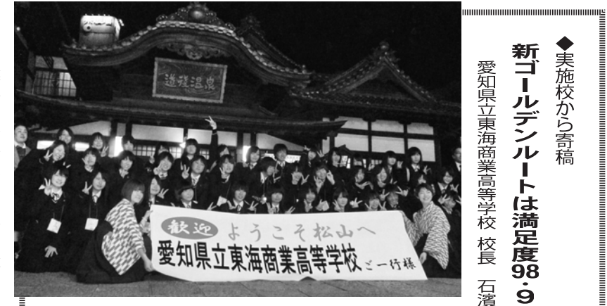
◆実施校から香稿 新ゴールデンルートは満足度98.9%

お遍路文化を体験できる石手寺の「お抄撫」。松山で未来の自分へのメッセージ。松山で未来の自分へのメッセージ。