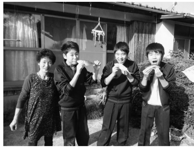
民泊では自分たちで釣った魚を調理して食べた

神奈川県藤沢市の湘南学園中学校(山田明彦校長)は、80周年の歴史と伝統を誇る中高一貫の私立学校。独自のカリキュラムで「たくましく生きる」を教育の理念として、昨年からは「持続可能な社会の実現」をテーマとして、今年度は「持続可能な社会の担い手」として、13年度の修学旅行を実施した。修学旅行は、今年度から「持続可能な社会の実現」をテーマとして、13年度の修学旅行を実施した。修学旅行は、今年度から「持続可能な社会の実現」をテーマとして、13年度の修学旅行を実施した。