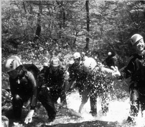
渓流を遡上するシャワークライミング

ふるさと体験学習協会 〒028-8030 岩手県久慈市川崎町1-1 TEL: 0194-75-3005 FAX: 0194-75-3007 E-mail: info@kuji-taikens.jp URL: www.kuji-taikens.jp/