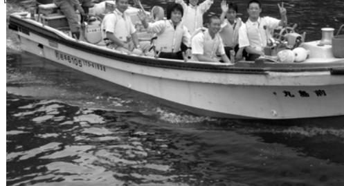
田野畑村の定番、サッパ船アドベンチャーズ

NPO法人体験村・たのはたネットワーク 〒028-8402 岩手県下閉伊郡田野畑村北山129-10 北山崎ビジターセンター内 TEL: 0194-37-1211 FAX: 0194-33-3355 E-mail: taiken-tanohata@car.ocn.ne.jp URL: http://www.tanohata-taikens.jp/