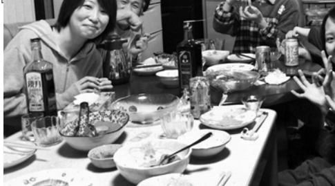
食事の準備なども一緒に行う民泊体験

のだ暮らし体験村 〒028-8201 岩手県九戸郡野田村 大字野田20-14 野田村役場産業振興課内 TEL: 0194-78-2926 FAX: 0194-78-3995 E-mail: kouki@vill.noda.iwate.jp URL: http://www.vill.noda.iwate.jp/