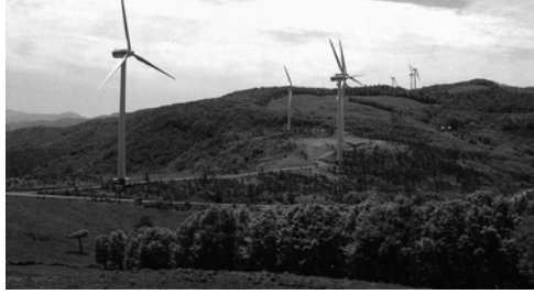
風力発電所でクリーンエネルギーを学ぶ

くずまき高原牧場(プラトー) 〒028-5402 葛巻町葛巻40-57-176 TEL: 0195-66-0555 FAX: 0195-66-0511 E-mail: admin@kuzumaki.jp URL: http://www.kuzumaki.jp/