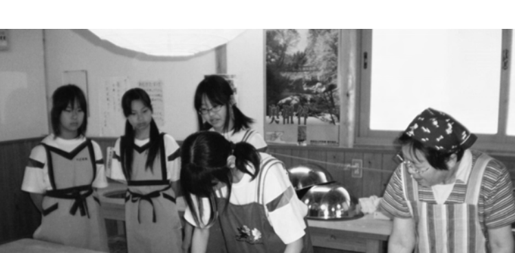
山里の伝統的な料理そば打ちを体験