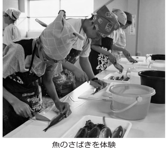
魚のさばきを体験