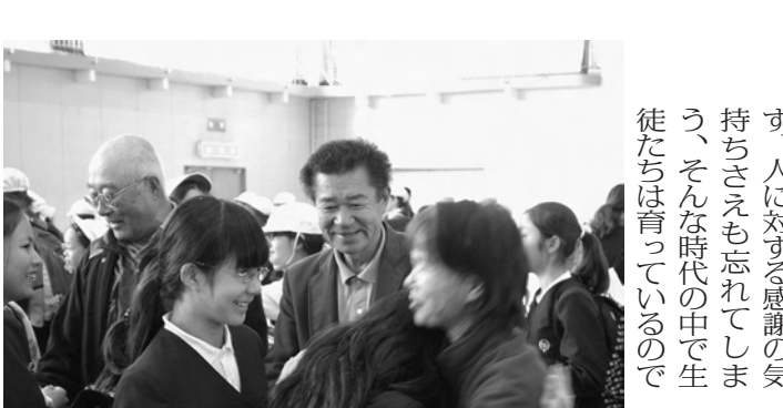
感動の民泊で別れに思わず涙する