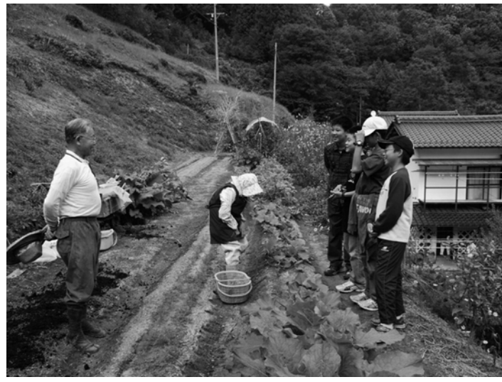
家族の一員になる民泊、最初の対面