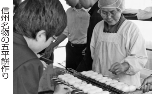
信州名物の五平餅作り