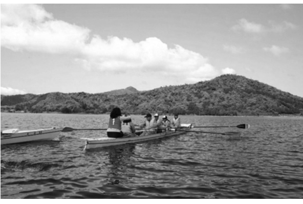
若狭美浜では、心をついにボート体験