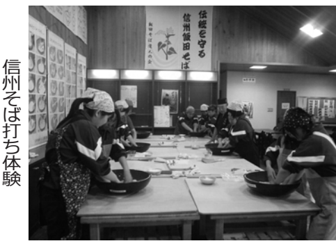
信州そば打ち体験