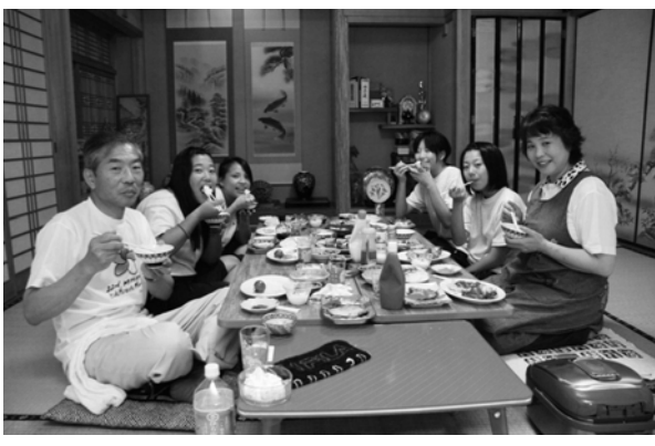
心のふれあう民泊家庭でのままを体験