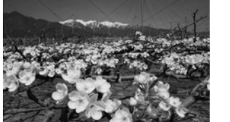
5月に咲き誇る梨の花