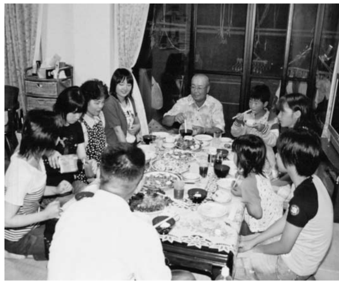
家族の優しさに触れる農村民泊