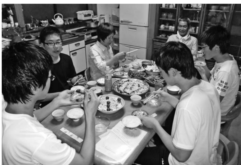
民泊先で触れ合いのひとつ