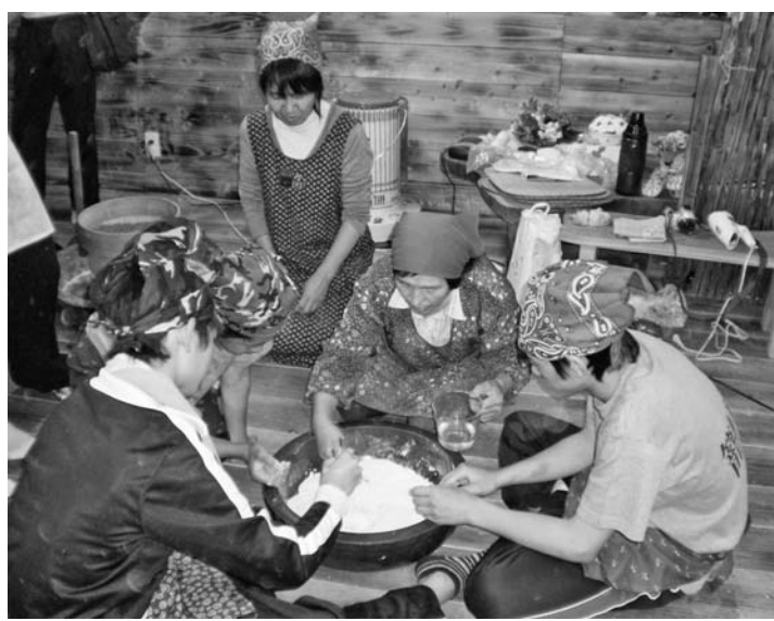
山里の伝統的な料理そば打ちを体験