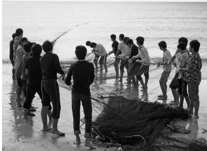
「感動しま旅！五島」の漁業体験プログラム地引網