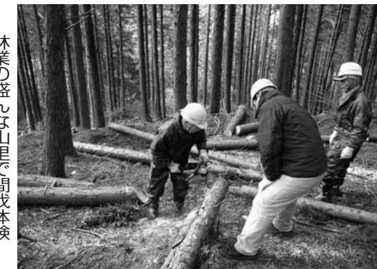
林業の盛んな山里、間伐体験