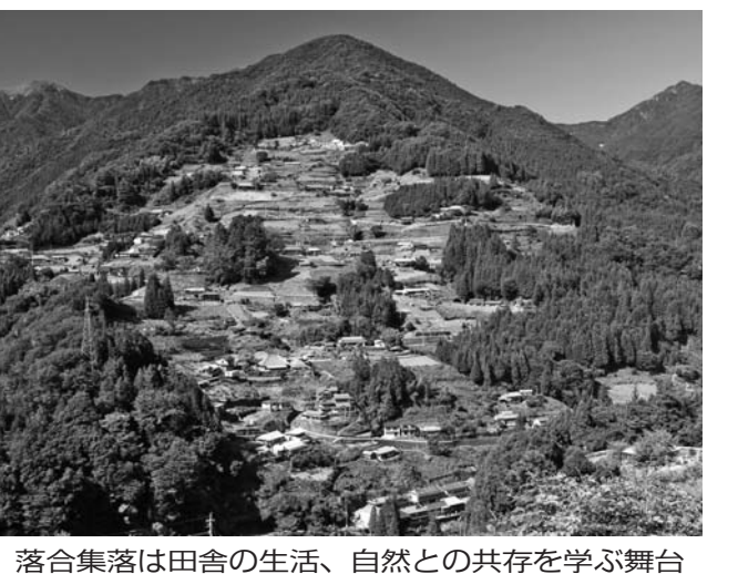
落合集落は田舎の生活、自然との共存を学ぶ舞台

をみると、地域で何かを... あいはい「生きる力」を育れ地域全体が元気を取り、自信を誇り、豊かさを取り戻し、さらには地域振興や地域活性化も推進できると思われます。自信のプログラムは、急傾斜地の農作業、そば打ち、ラフティングなど。