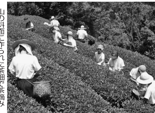
山に斜面に作られた茶畑で茶摘み