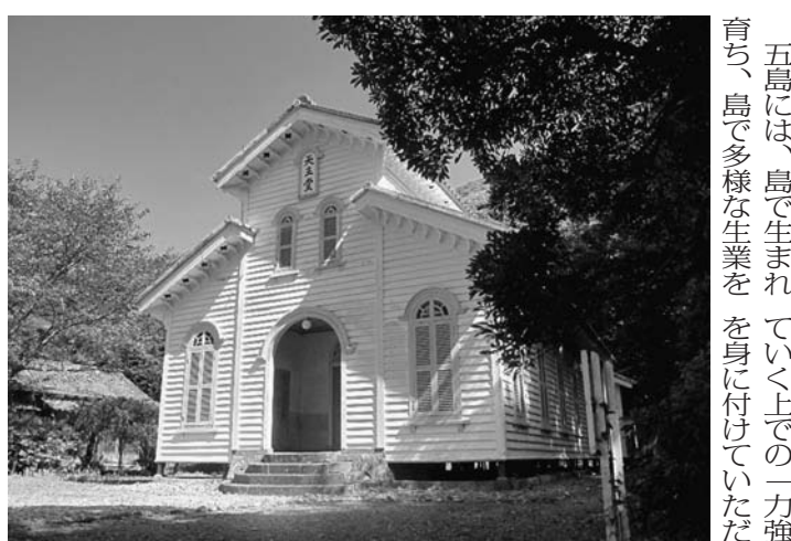
世界遺産登録を目指す教会群の1つ江上天主堂

五島市は、九州の最西端、長崎県の西方海上約100kmに位置しています。大小152の島々からなる五島列島の南西部にあり、11の有人島と52の無人島で構成され、その大部分が西海国立公園に指定されている美しい風景を有しています。