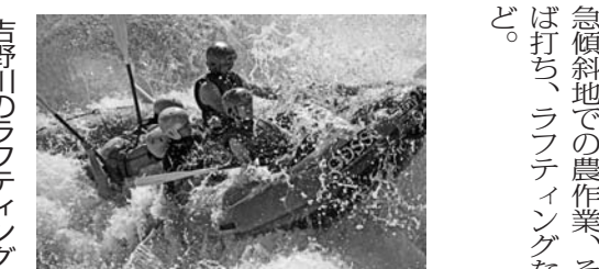
吉野川のラフティング