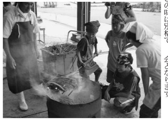
カツオのたたき作りを体験

二丁の高まっており、導しなから鱈を一本から、また進む見景観は、すま山漁村の民泊体験、捌いて焼く、たたき、都会では見ることのでき