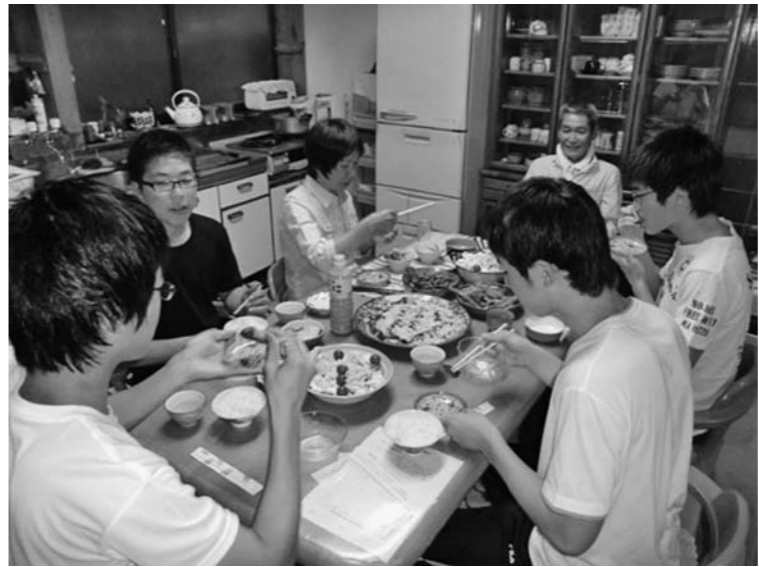
民泊先で触れ合いのひととき

四万十市の南部に位置する「の舞台」とも取り上げる高知県のしんぐら。あな、この地域の「ア」は「何もないのに、な」は「何もないのに、な」は「何もないのに、な」は「何もないのに、な」