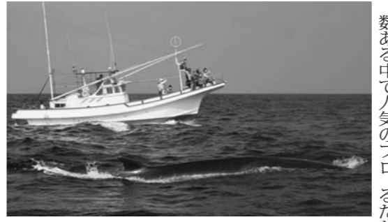
驚異の体験、ホエールウォッチング