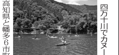
四万十川でカヌー

二丁の高まっており、導しなから鱈を一本から、また進む見景観は、すま山漁村の民泊体験、捌いて焼く、たたき、都会では見ることのでき