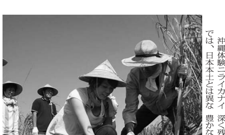
サトウキビ畑で刈り取りを体験