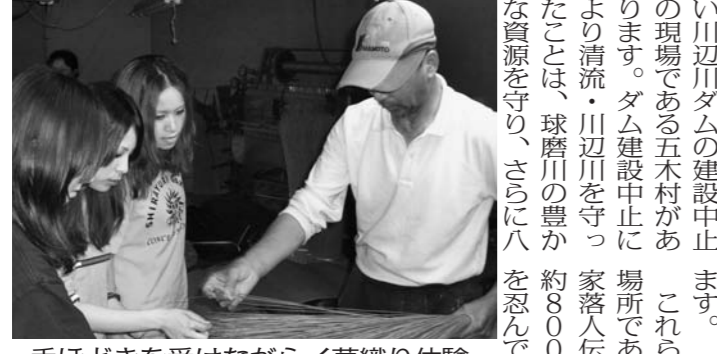
手ほどきを受けながら草織り体験