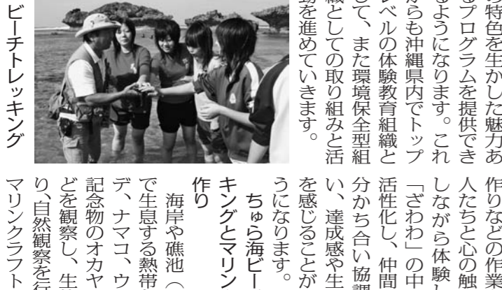
ビーチトレッキング