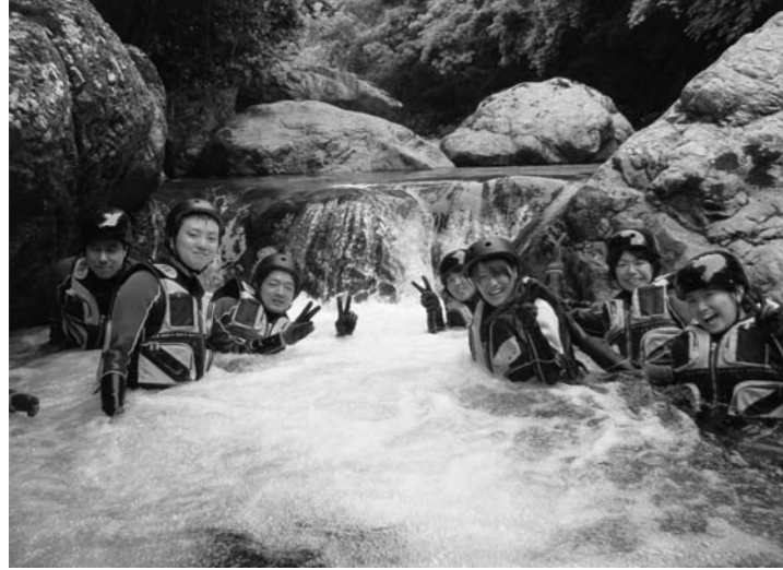
身体一つで沢を滑降するキャニオニング