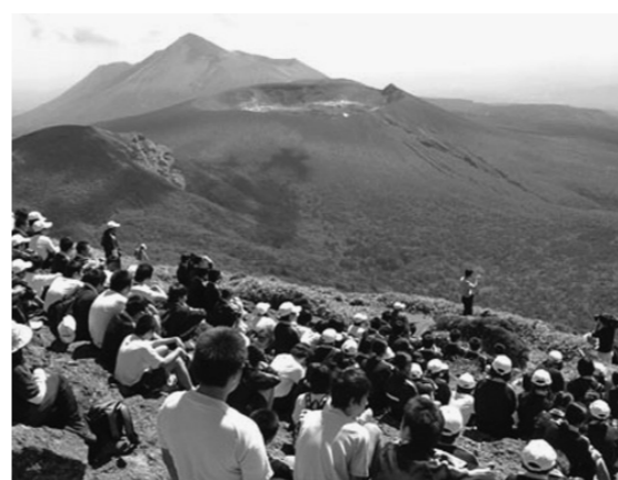
霧島山トレッキング