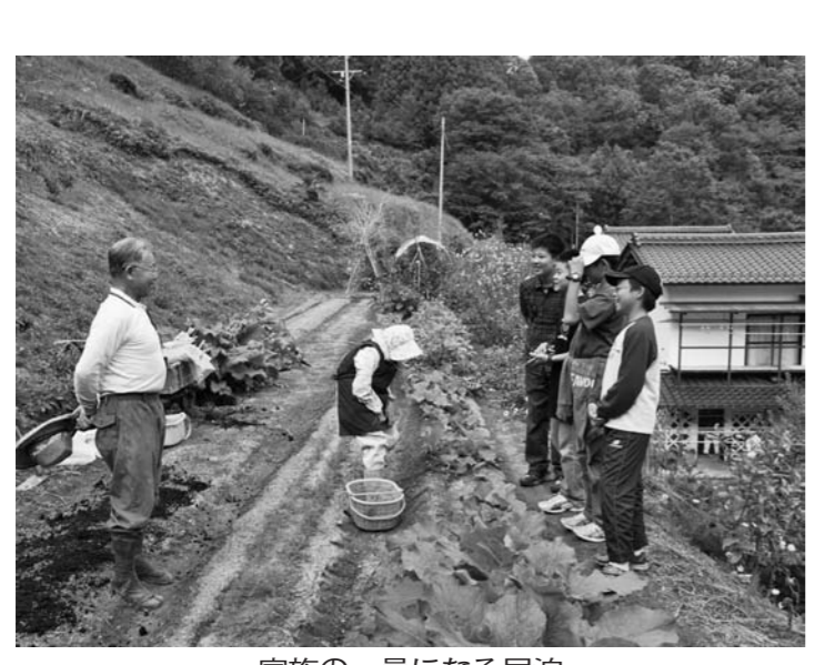
家族の一員になる民泊