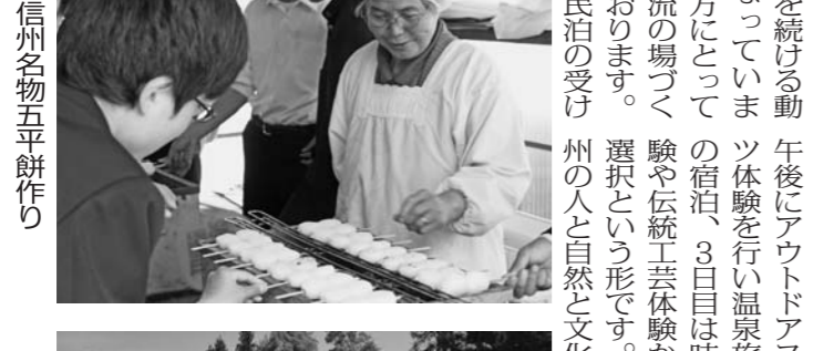
信州名物五平餅作り