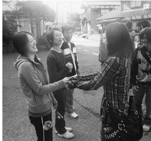
心のふれあう民泊家庭ありのままを体験する