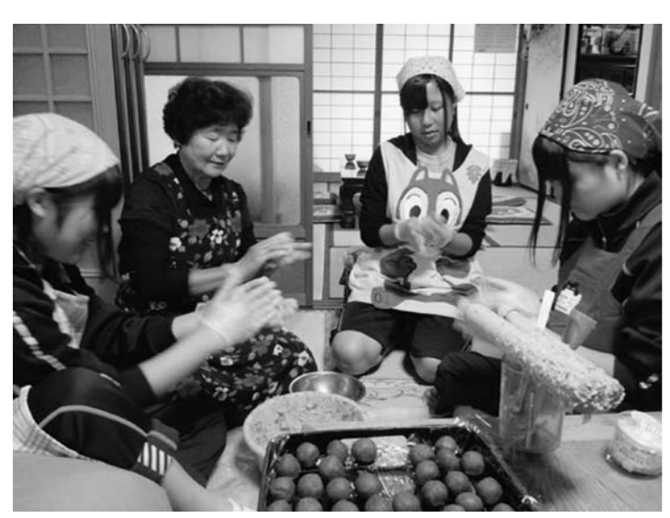
よもぎ餅作り(距離が交流を深める)