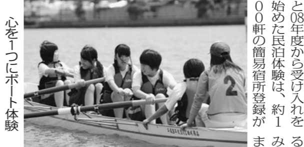
心をつなぐ民泊体験