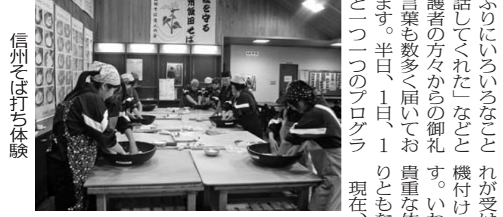
信州そば打ち体験