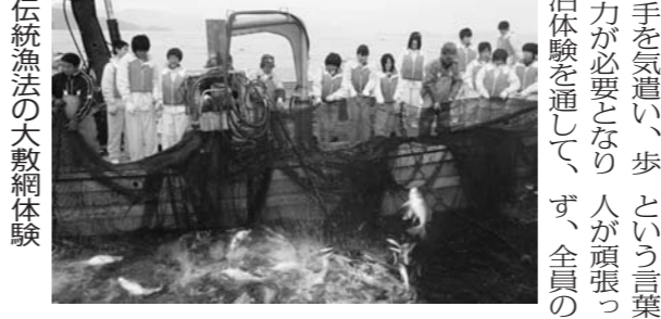
伝統漁法の本鮎体験

福井県美浜町には、日接し、どのように人間関係を構築すべきか分からず、清らかな川や湖には、魚や鳥の姿が目に飛び交い、町の名産品として、企業が重視する要素として、9年連続で1位という結果を出しているよう恵みをいただき、それを生かしてまいります。 「若狭美浜はあつる体験」は、このような自然環境を生かした「漁業」「林業」「自然・芸術・歴史文化」と「アグロ・ツーリズム」に富んだプログラムを整えています。