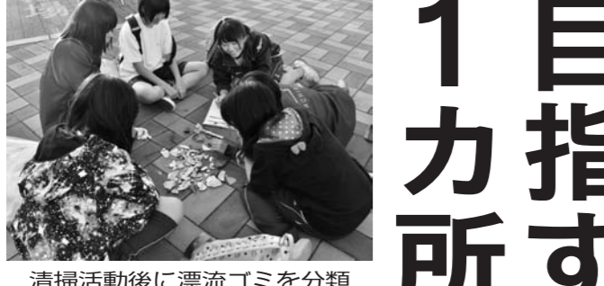
清掃活動後に漂流ゴミを分類する様子