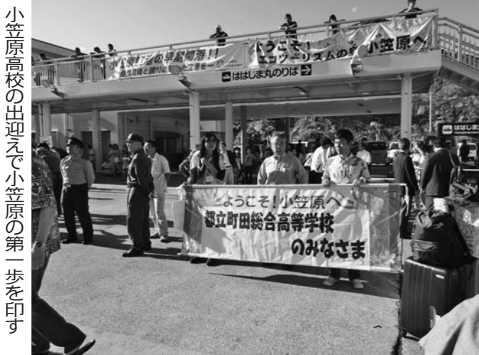
小笠原高校の校舎と校門の様子

高校の修学旅行や教育旅行は大きく様変わりしてきた。単に見る行為から一歩進んで自ら五感を使って何かを感じ取る体験が主流となった。あるいは、核家族化で希薄になった人間関係を肌で感じる民泊も人気が高い。一方で、多感なこの時期だからこそ、日本の歴史や文化に触れて、知識と日本人の生き方を自ら感得する必要性がグローバルな世界では改めて問われている。学校が求め、実施している旅行とはどのようなものか。目的や教育的意図、効果などを取材した。