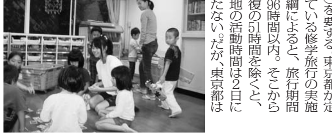
保育園でのインターンシップの様子

東京都立 調布南高等学校 広島・島根 3泊4日 12年11月 実施 東京都調布市の東京都立調布南高等学校(相模 恒例)は、2012年度は初めて、重点支援校に指定された。広島、島根を先行して、中規模校に指定された。広島、島根を先行して、中規模校に指定された。