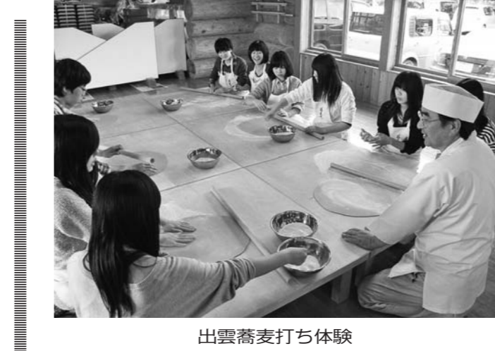
出雲蕎麦打ち体験の様子

東京都立 町田総合高校 東京都・小笠原 5泊6日 12年12月 実施 東京都内に10校ある総合高校の一つが、東京都立町田総合高校(高橋)。「自然」の4系列(創校)・社会創り・未来創り・自己創り」を軸に、キャリア教育の「学び」を軸に、生徒の教育に力を入れている。この「学び」を軸に、生徒の教育に力を入れている。この「学び」を軸に、生徒の教育に力を入れている。