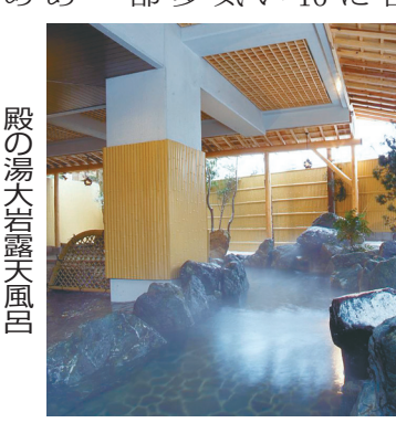
殿の湯天岩露天風呂

温泉は今年で開業86年と、温泉地の歴史ある宿。ホテルは今年で開業86年と、温泉地の歴史ある宿。ホテルは今年で開業86年と、温泉地の歴史ある宿。