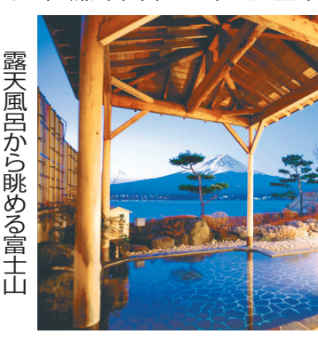
露天風呂から眺める富士山

その魅力は海外でも注目を集めている。また、夜の「美人の湯」は、美人になれる温泉水が注ぎ込まれる。また、夜の「美人の湯」は、美人になれる温泉水が注ぎ込まれる。