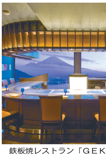
鉄板焼レストラン「GEKKO」月虹

温泉旅館が自慢だが、料理もまたKUKUNAの魅力の一つ。旬の食材と地元産の新鮮な野菜を使用した料理が、元来の旅館の満足度をさらに高めた。