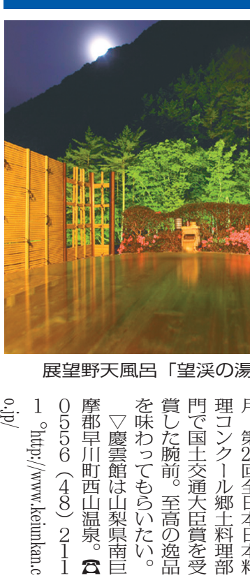
展望野天風呂「望溪の湯」

「望溪の湯」。天然温泉と抜群の自然環境、健康志向の料理、爽快感、神聖な空間、旅の寿命も10年は伸びるかも。2008年1月には新設された「温泉」がオープン。設備がさらに充実した。馬場温泉郡湯島村万座温泉。0279(97)3131。http://www.manzawater.com/