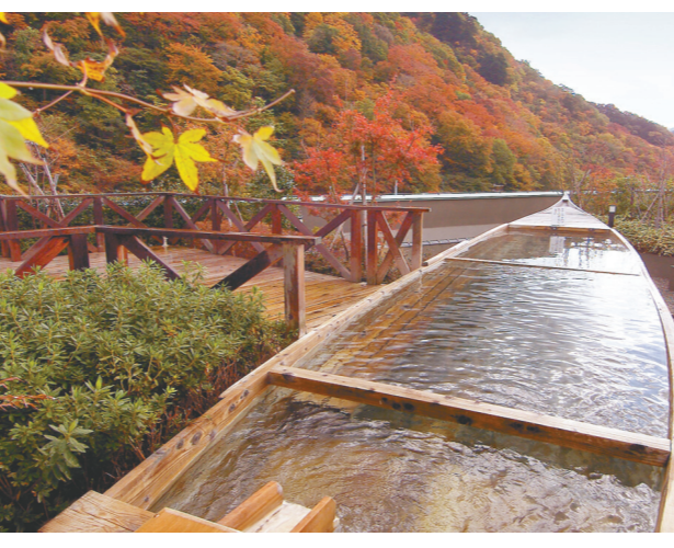
空中庭園露天風呂 (舟風呂)