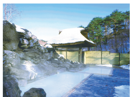
雪景色の天沢の湯