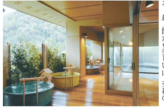
露天風呂を備えた「清流の湯」