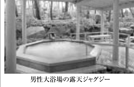
男性大浴場の露天ジャグジー

栃木 湯西川温泉 環境に優しい旅館を目指します。平成20年2月11日には「ISO14001」取得。創業300余年の老舗は、いまも変わることなく湯西川の里に湯けむりを上げ、全国からの銘木、古木の吟味し、意匠を凝らした客室は、同じ客室はひとつもない。