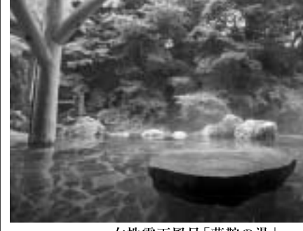
女性露天風呂「藤籐の湯」