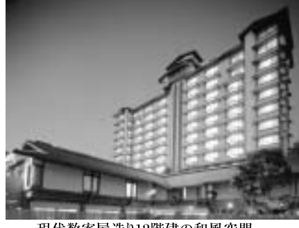
現代数寄屋造り12階建の和風空間