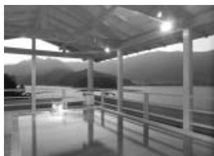
見はらし露天風呂「湖の湯」

山梨 富士河口湖温泉郷 「大切なときに、大切な人と。」湖山亭うぶやは、2009年3月20日にリニューアルオープンいたしました。露天風呂付客室、エステルーム、談話ラウンジ、ダイニングの新設、ロビーラウンジ、売店、フロント部分全面改装。長年培ってきた「おもてなしの心」を变えることなく、大切なときに、大切な人と、をコンセプトとして、お客様が大切なひととより充実した「とき」をお過ごしいただけるための様々な工夫をしております。