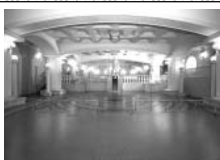
300名同時に入れるローマ風呂