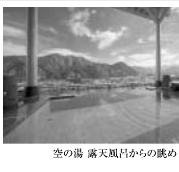
空の湯 露天風呂からの眺め