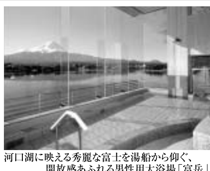
河口湖に映える秀麗な富士を湯船から仰ぐ、開放感あふれる男性用大浴場「富岳」