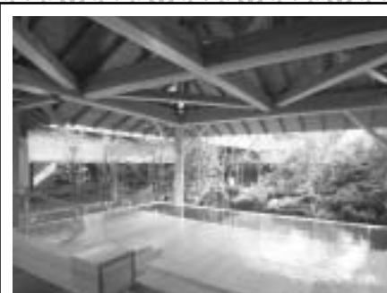
「はたるの湯」檜露天風呂