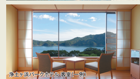
津守ヶ浜パークホテル 客室(一例)