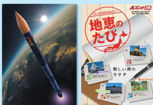
観測ロケット「MOMO」初号機(イメージ)

旅行&MICEの新たな需要を創出する「AユニットJTB」は各地の魅力ある素材と法人顧客の課題解決をマッチングした多彩なプログラムをご用意しています。一例として、2017年7月、民間初のロケット打ち上げ実験で話題となった北海道大樹町は官民一体でアジアNO.1の「スペースタウン構想」を掲げて宇宙のまちづくりに取り組んでいます。施設見学、講話に加えて、モデルロケット制作や打ち上げ実験を体験できるプログラムを商品化して、企業研修、行政視察、並びに修学旅行等の参加者の「学び」「気づき」「活力」醸成と地域活性化双方への貢献に取り組んでいます。