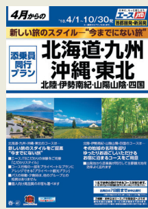
※パンフレットは発地によりデザインと地域分けが異なります。