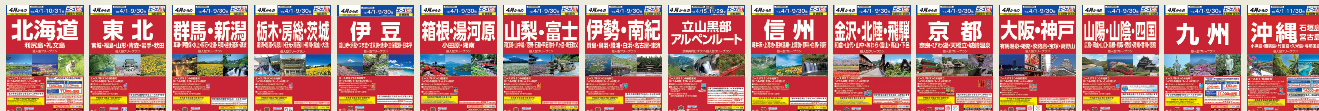
※パンフレットは発地によりデザインと地域分けが異なります。

エースJTBの赤いパンフレットでは品質へのこだわりに加え、お客様に「泊まる」楽しさをお届けするため、それぞれのホテル・旅館の楽しみ方を「エースJTB」のお約束としてご提案しています。