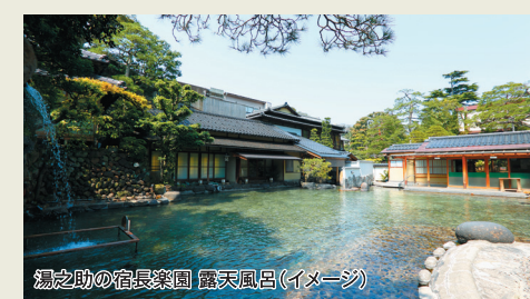
湯之助の宿(長良川 露天風呂(イメージ))