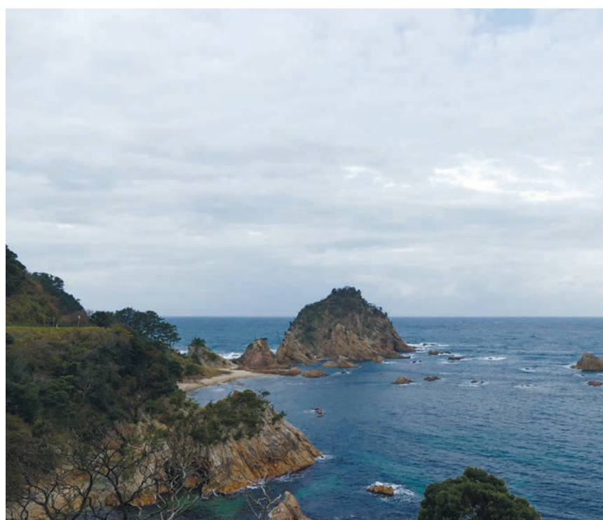
山陰海岸ジオパークの浦富海岸