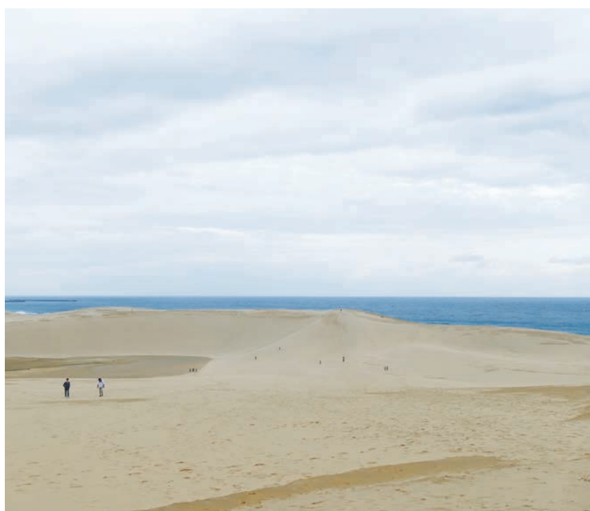
ポケモンGOで注目を集めた鳥取砂丘