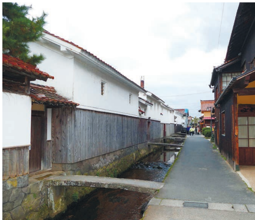
倉吉白壁土蔵群周辺も通常通り営業