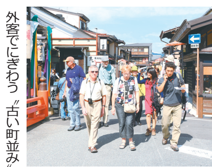
外客で賑わう、古い町並みがなる拡大が期待で

取組名「官民協働での外国人観光客の誘致・受入」 飛騨高山国際誘客協議会、高山市(岐阜県)の官民33企業・団体で構成する組織。平成15年の発足以来、外国人観光客の誘致と受け入れ態勢整備の取り組みを官民一体で進めている。