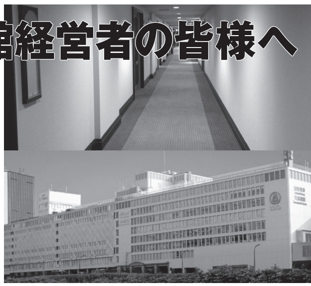
当社施工実績。(上) Cホテル (下) Kビルディング