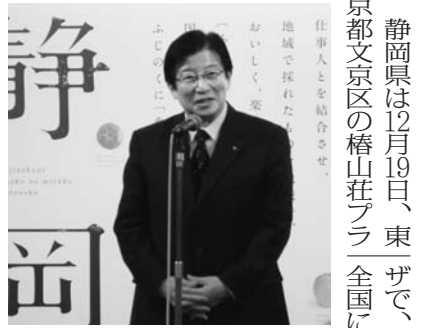
静岡県で交流会開催 静岡県は1月19日、東、西、南、北の4つのエリアで、県の豊富な食材をPRするための交流会を開催した。