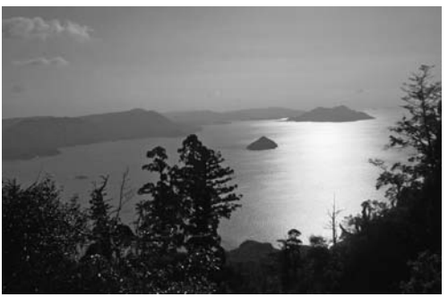
宮島山からの瀬戸内海の多島美

宮島山からの瀬戸内海の多島美。体験型観光の現場。宮島山からの瀬戸内海の多島美。体験型観光の現場。宮島山からの瀬戸内海の多島美。体験型観光の現場。