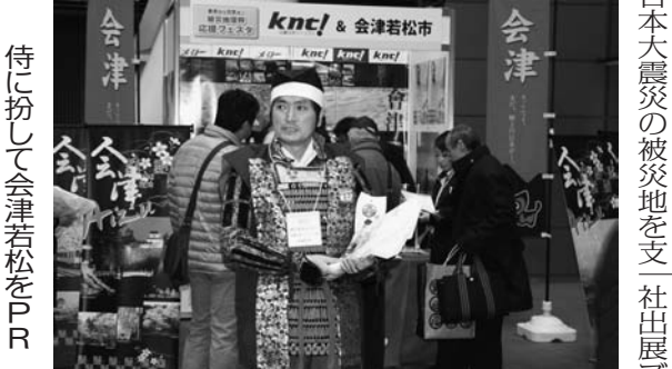
会津若松の復興を支援 KNTイベント出展に協力

KNTイベント出展に協力 近畿日本ツーリストは、東日本大震災の被災地支援の一環として、会津若松市に協力を要請した。