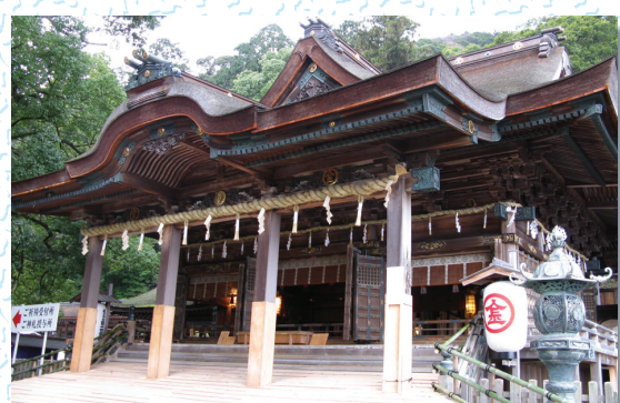
金刀比羅宮御本宮