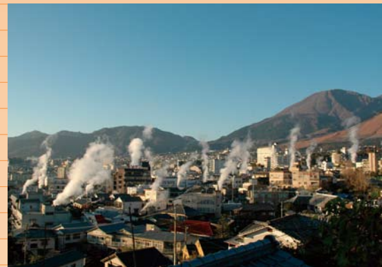
別府の温泉は、別府、鉄輪、観海寺、明鏡、龍川、柴石、堀田、浜島の日力所の温泉郷を中心に湧き出ており、通称「別府八湯」と呼ばれる。日本一を誇る湧出量と源泉数の多さは、鶴見岳や伽藍岳といった活火山の活動の恩恵だ。