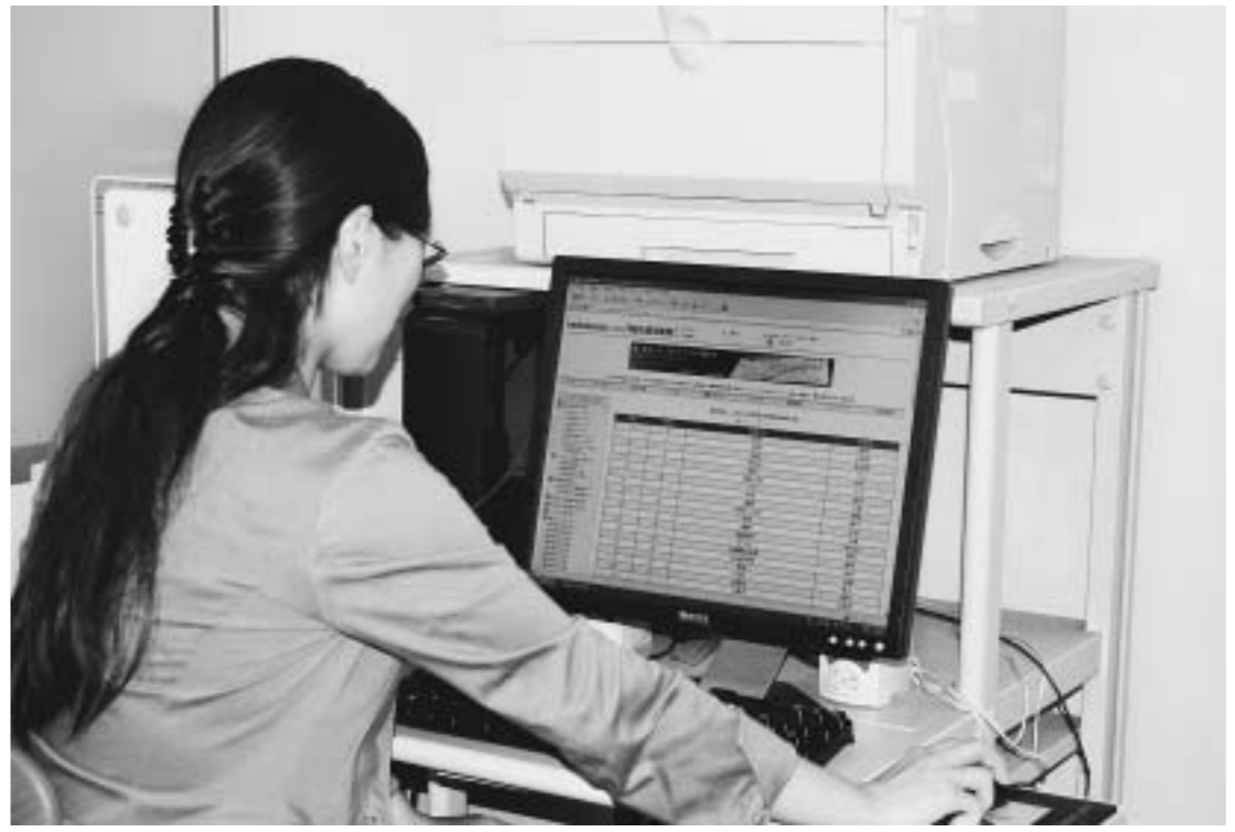
情報機器を賢く使いこなすことが売り上げアップ