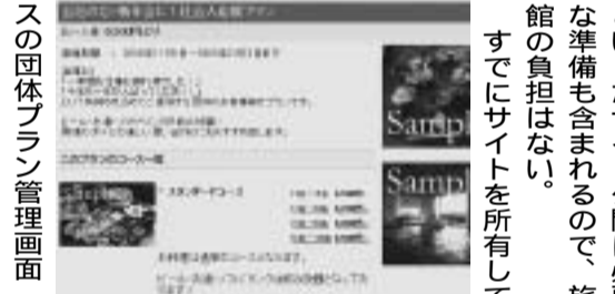
宿シスの団体プラン管理画面

広く充実したサービス内容といったサイト公開に必要な準備も含まれるので、旅効果も上がるサイトへと進化させる。 宿シスは、コンピュータの専門知識がなくても簡単に扱える操作性も売りだ。管理者専用ページで宿泊プランの内容、価格、写真、掲載時期などを任意で設定できる。 最近では、団体向けプランにも対応できるようにシステムを改良。今後は、カード決済機能を付加する予定だ。