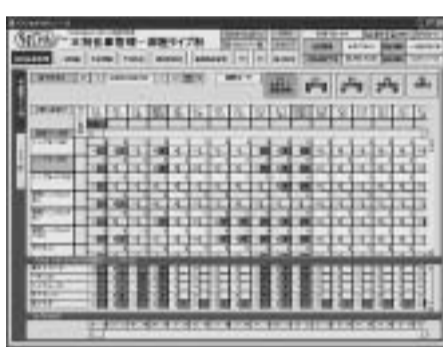
らくじゃんの日別在庫管理画面

販売ルートの旅行会社だけでなく、ネットエージェンツ、自社ホームページも加って多様化するとともにネット予約の比重が高まっている。予約担当者は業務が増加したうえ煩雑化しているのが現状だ。このため旅行会社とネットエージェンツからの送客情報を一元管理し、さらには双方の在庫情報と販売実績を一元的に把握する仕組みが求められていた。