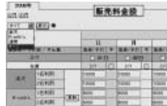
管理画面で別々の料金を設定

モバイル機能や英語機能、グループ管理機能なども無料で標準装備。携帯版自社サイトを持つていない施設でも自社の携帯予約サイトを無料で開設できる。客室在庫は自社サイト分と運動しており、二重の部屋管理は不要だ。自社サイトに英語版サイトを持っている施設は英語版予約機能を使う。日本語サイトとは別の料金設定もできる。