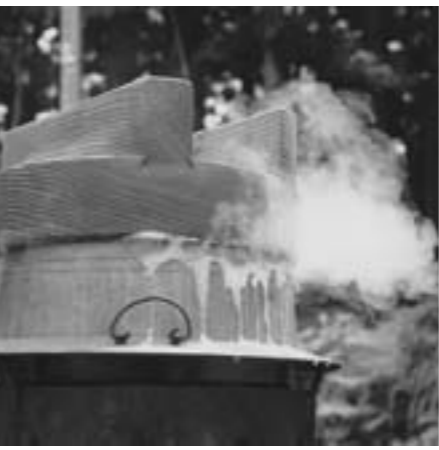
米どころの新潟、めか釜で炊くご飯はまた格別(写真左)。写真下は兼続と上杉景勝が少年期に学問を学んだ雲洞庵(南魚沼市)