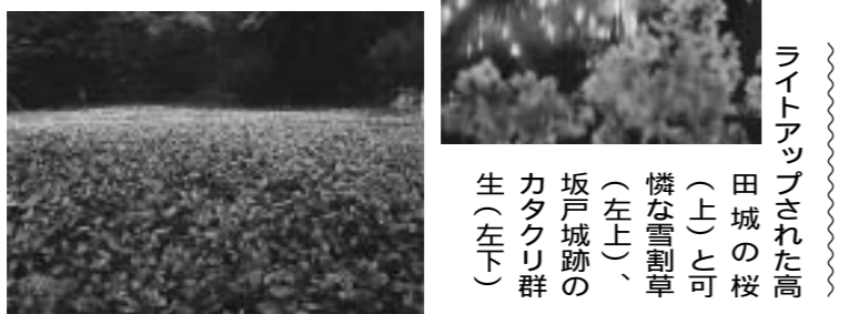
田城の楼(上)と可憐な雪割草(左下)、坂戸城跡のカタクリ群生(右下)