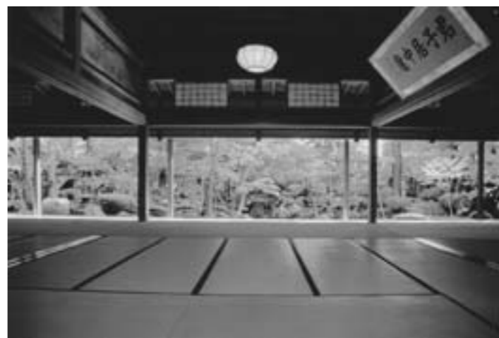
豪農の館「北方文化博物館」は登録有形文化財でもある(新潟市)

新潟県などが舞台となつたNHK大河ドラマ「天地人」の再演などで、ドラマの世界を体験できる。また、ゆかりの各地の料理店では上杉軍の出陣の際の言い伝えにちなんだ料理も提供される。