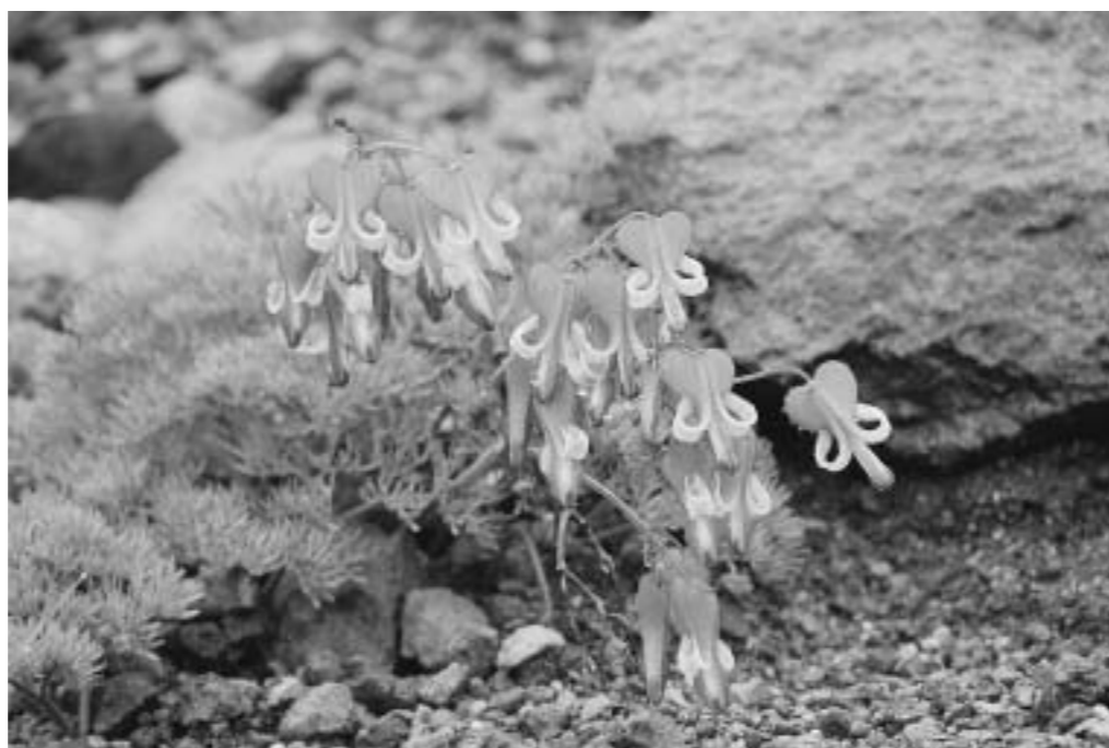
夏を象徴する本白根山のコマクサ