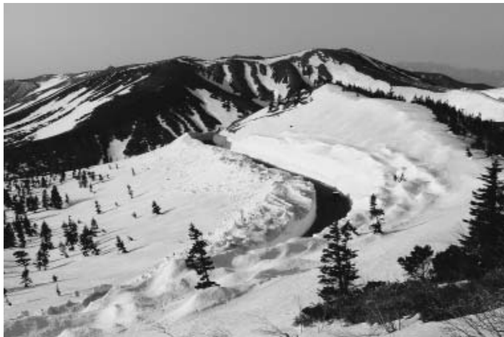
春の志賀草津高原ルート