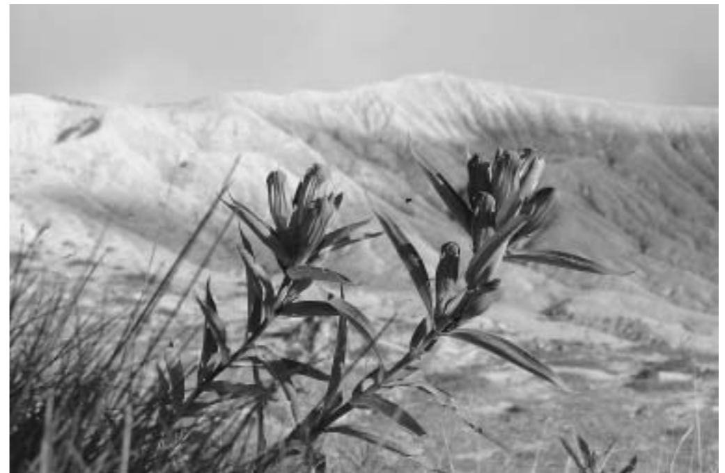
秋はリンドウの花が観光客をもてなす