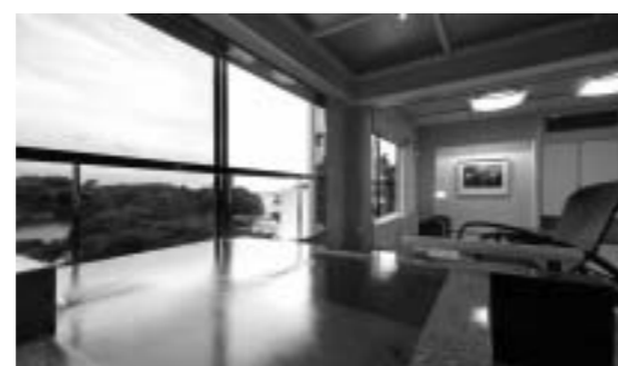
宮城県/松島 ホテルニュー小松 好風亭 客室2室を展望露天風呂付客室「海庭」に改装 自力販売力を強化する施設商品整備