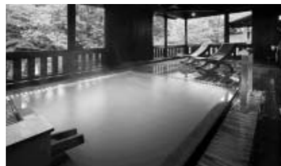
山形県/蔵王温泉 蔵王国際ホテル 新客層開拓を目指し、2フロア20室の客室と貸切風呂を改装