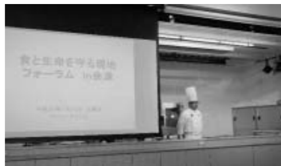
福島県/磐梯はやま温泉 ヴィライナワシロ コンベンションをキッズスタジアムに改装 産地産物へのこだわりをアピール