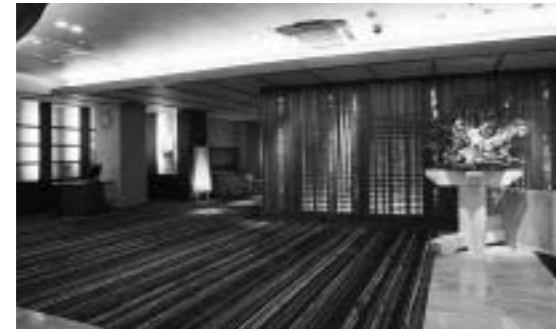
滋賀県/おこ湯温泉 湯元館 耐震工事に伴う玄関・ロビーの改装と、 客室から個室料亭への改装で商品力を向上