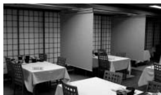
岩手県/つなぎ温泉 愛真館 既存宴会場を改装し、個人客向けの お食事処「花鳥・風月」を新設