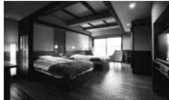
山梨県/河口湖 富士レークホテル 河口湖に臨む、ユニバーサルデザイン対応の 3タイプ10室の露天風呂付客室を新設