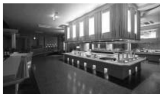
群馬県/伊香保温泉 ホテル天坊 個人客に向けた新たな食事提供 地産地消「旬の坊」