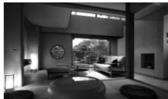
三重県/鳥羽温泉 御宿 The Earth 地球の鼓動を感じる宿 全16室の高質旅館を新築オープン