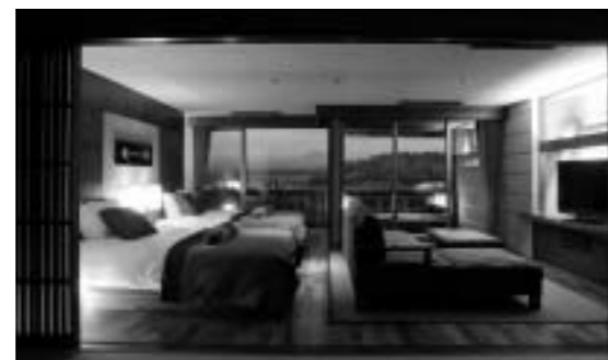
石川県/山代温泉 ゆのくに天祥 客室2室を展望露天風呂付客室「海庭」に改装 をスイートタイプの特別フロア「然Zen」としてオープン