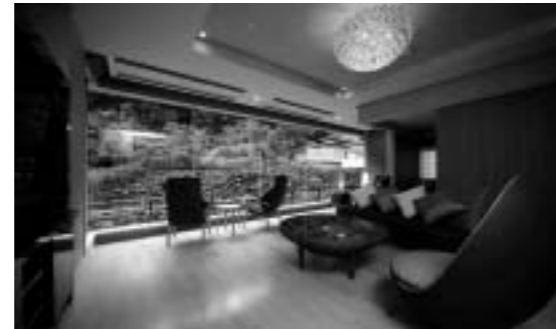
新潟県/湯沢温泉 双葉 各階1室ずつの3室の特別室と食事処、エステサロンを有する 7階建てのやすらぎ棟「花水木」を増築