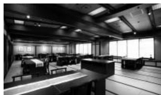
長野県/木曾福島 街道浪漫 おん宿 葛屋 名称も新たに、食事処を中心としたリニューアルによる 個人客主体営業への転換