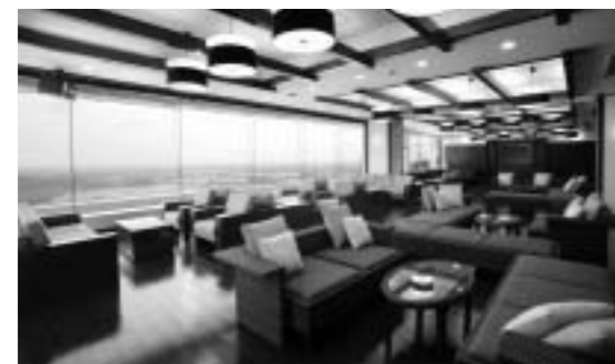
茨城県/つくば市 筑波山ホテル 青木屋 玄関・ロビーまわりのイメージアップ 宴会場を椅子・テーブル形式のダイニングに改装