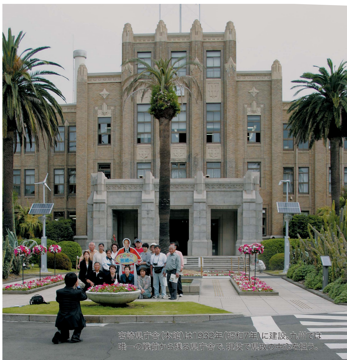
宮崎県庁舎(本館)は1932年(昭和7年)に建設。九州では唯一の戦前から残る県庁舎で、現在県政の中心を担う。