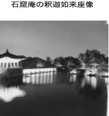
美しく照らされた雁鴨池

この地には、韓国の文化を伝える地域として知られている。この地には、韓国の文化を伝える地域として知られている。この地には、韓国の文化を伝える地域として知られている。