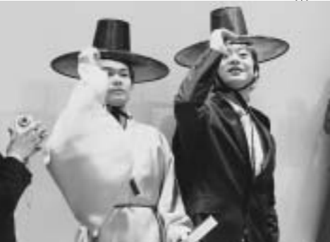
ショーに向けて演技指導も

この地には、韓国の文化を伝える地域として知られている。この地には、韓国の文化を伝える地域として知られている。この地には、韓国の文化を伝える地域として知られている。