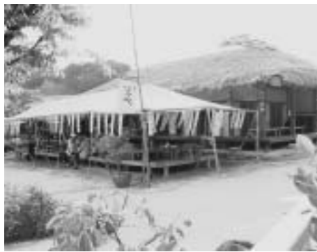
ソンピ村内の酒家

ソンピ村は、慶尚北道大邱市東区にあり、1970年代にソビエト連邦から移住してきたソビエト系住民が建てた村。村の中心には、ソビエト連邦の文化を再現した建物があり、ソビエト料理や音楽を楽しむことができる。また、村にはソビエトの学校や病院もあり、ソビエトの生活様式を体験することができる。