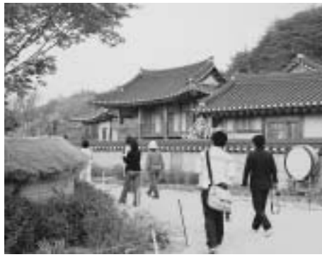
村の様子が再現されたソンピ村