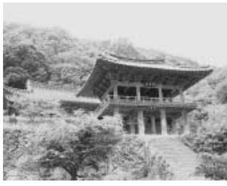
韓国最古の木造建築浮石寺