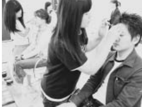
男性もメイクアップを体験