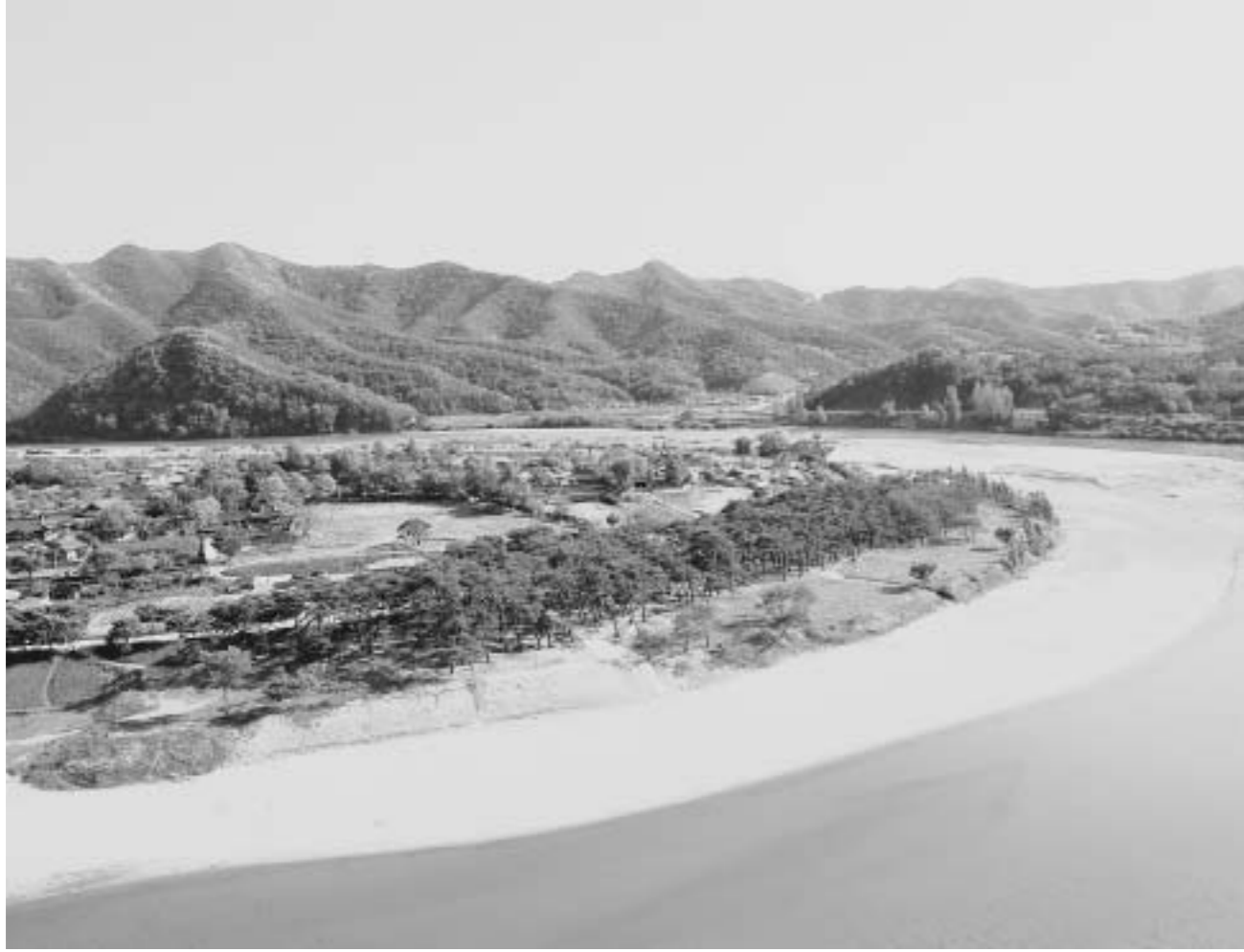
英容台から河回村を望む