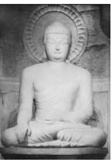
石窟庵の釈迦如来坐像

新羅王朝の首都である慶州は、新羅の歴史を伝える多くの文化遺産を数多く残している。その中でも、新羅の歴史を伝える多くの文化遺産を数多く残している。その中でも、新羅の歴史を伝える多くの文化遺産を数多く残している。