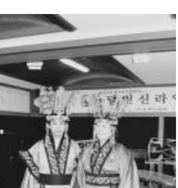
大陸の影響が強い伝統衣装