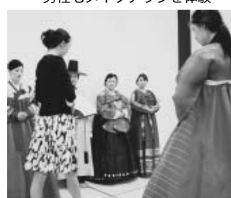
教授からウォーキング指導を受ける