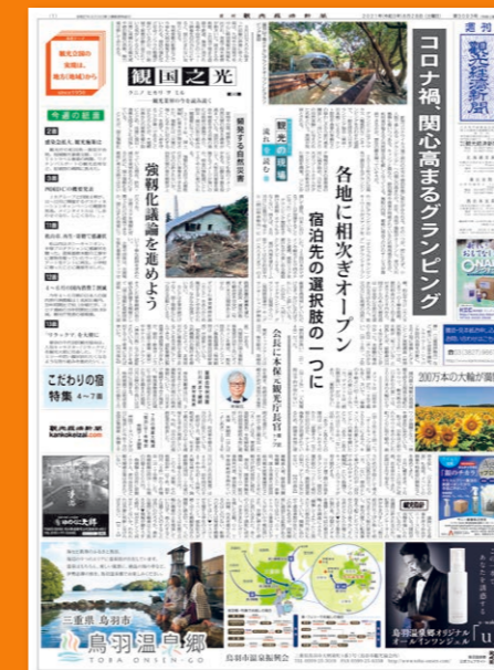
週刊観光経済新聞