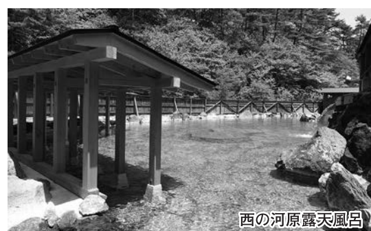
西の河原露天風呂